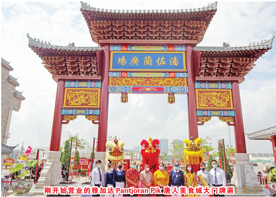
刚开始营业的雅加达 Pantjoran Pik 唐人美食城大门牌匾 2020