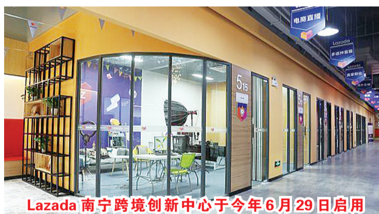
Lazada 南宁跨境创新中心于今年6月29日启用

2020年是中国—东盟数字经济合作年，双方将进一步挖掘合作潜力。东盟秘书长林玉辉表示，预计到2025年，东盟的数字经济将从2015年占GDP的1.3%提高到8.5%。中国在智慧监管中心看到，全自动系统设备正在对国际邮