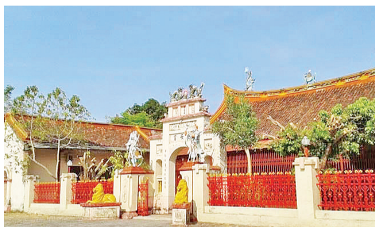
中爪哇 lasem 的华人寺庙富有中式建筑风格

千禧一代的建筑师、建筑专业的学生、城市建筑师、房地产开发商和在城市遗产地区从事商业和旅游业等有524名参与者参加，