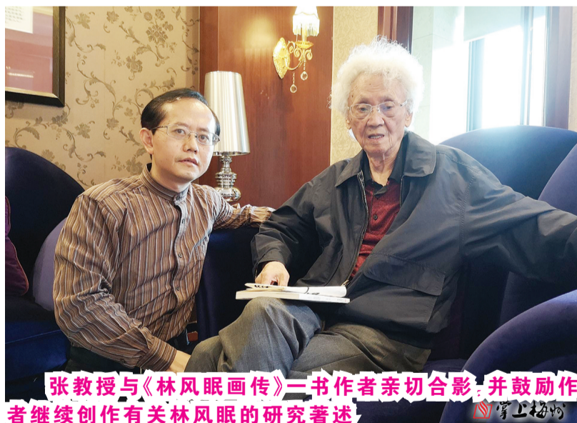
张教授与《林风眠画传》二书作者亲切合影，并鼓励作者继续创作有关林风眠的研究著述。