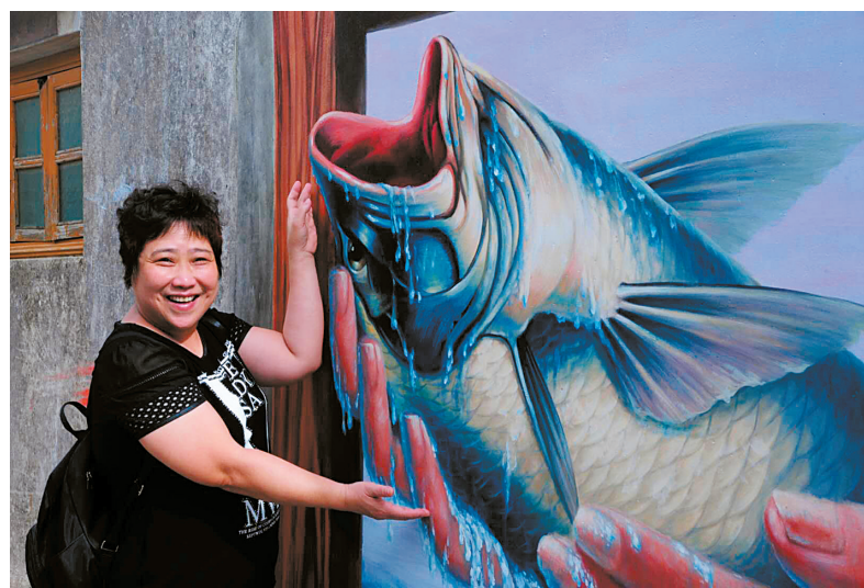
遊客看到逼真的大魚，興奮地跑上前：“看，我抓到一條大魚。”

近年來，汕頭市龍湖區新海街道十一合村大力發展“庭院經濟”，昔日寂寂荒廢的村落和庭院，成了獨具特色的文創藝術“網紅村”，每逢周末，村裏人山人海，不少市民專程前來“打卡”。