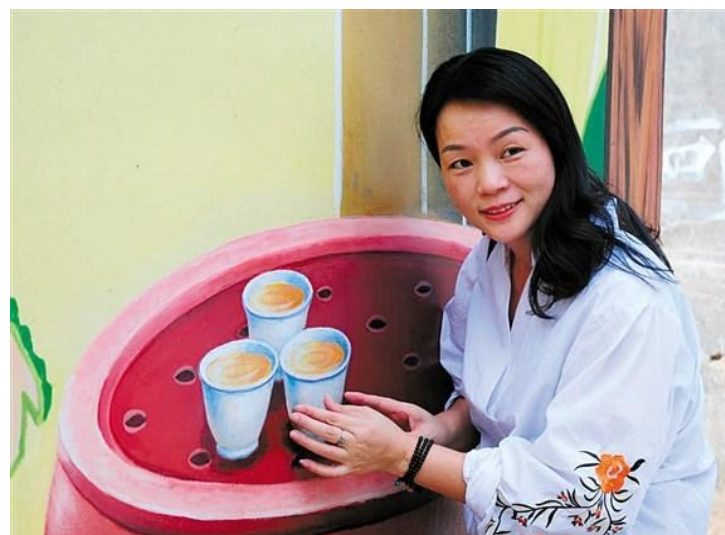
碩大的工夫茶具令遊客頗感興趣。

據悉，今年初，結合連片振興鄉村計劃，龍湖區政府大力投入資金對“糖寮埔”片、“四圍”片打造“十一合藝術村”，目前已完成糖寮埔片的巷道路燈架設、部分巷道“三綫”落地和步道磚的鋪設，為吸引更多藝術人才進駐該村，把潮劇、潮曲、潮汕鑼鼓等本土傳統文化和外來文化甚至中原文化緊密結合起來，吸引更多市民前來遊覽，為鄉村振興注入新活力，為汕頭打造又一張亮麗的鄉村名片。