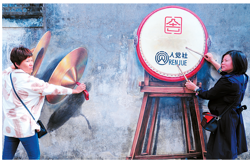
大鈸、大鼓等3D畫引來遊客一番互動，大家上前“大顯身手”。