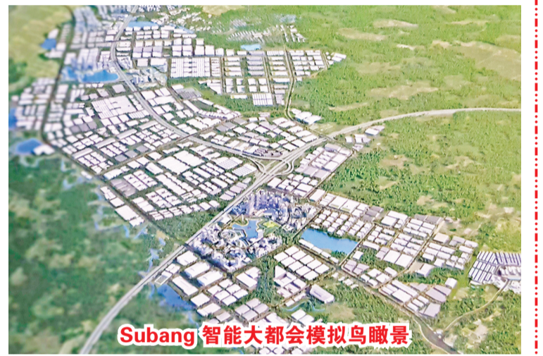
Subang 智能大都會模擬鳥瞰景

【本報訊】2020年11月18日(星期三)SuryaSemestaInternusa(SSIA)上市公司通過子公司Suryacipta Swadaya有限公司,為Suryacipta拥有的蘇邦智慧大都會(Subang Smartpolitan)自立城(Kota Mandiri)區域,在雅加達Gran Melia酒店舉行蘇邦智能大都會破土奠基儀式。出席者有許多准客戶和投資者,Suryacipta現有