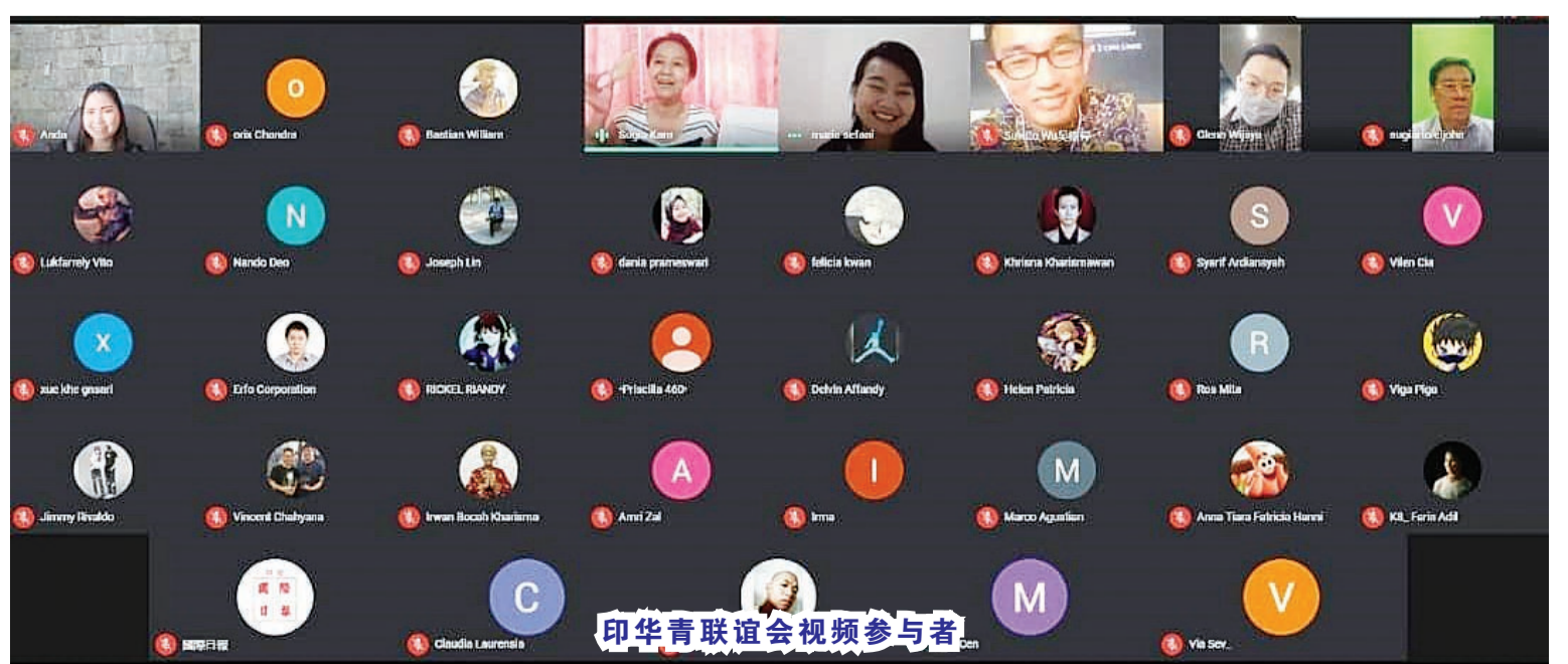
印华青联谊会视频参与者