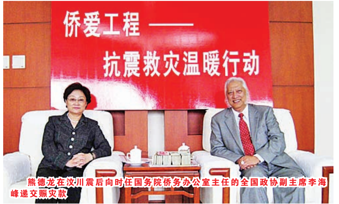
熊德龙在汶川震后向时任国务院侨务办公室主任的全国政协副主席李海峰递交赈灾款