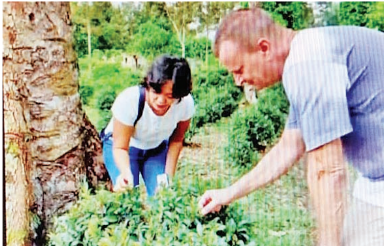
游客在采摘大宇茶