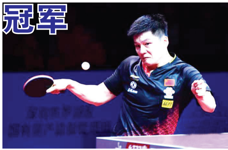
资料图：樊振东。

第五局，马龙调整了发球，并将节奏放慢，在4比5落后时上演绝地反击，以11比8险胜。随后，他再下一城，将总比分扳平。“没招儿了，只能放松打。”他笑道，“好在落后时没有放弃，心态也不像之前那么急躁，只想静下心来一分一分打。再加上对手领先后可能有些想法，有点慌。” 决胜局，马龙气势如虹，以11比4轻取对手。每得一分，“龙队”都大吼一声为自己鼓劲，终于赢下了这场“既精彩又艰苦的比赛”。