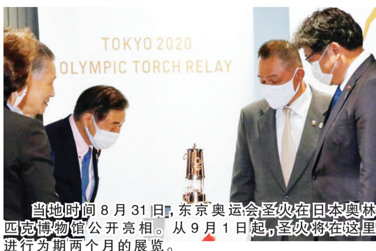
当地时间8月31日，东京奥运会圣火在日本奥林匹克博物馆公开亮相。从9月1日起，圣火将在这里进行为期两个月的展览。

中新网11月16日电 据外媒报道，16日，日本首相菅义伟与国际奥委会主席巴赫在东京举行会谈。菅义伟重申主办东京奥运会的承诺，并表示期待与巴赫在筹备工作方面密切合作。 据日本共同社报道，菅义伟16日与巴赫举行会谈表示：“决心于2021年夏季举办奥运会和残奥会，以证明人类战胜新冠病毒”。他还称，期待与国际奥委会和巴赫的密切合作。