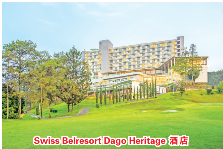
Swiss Belresort Dago Heritage 酒店

【本报讯】在骑自行车出发之前,先要填饱肚子。可在万隆 Swiss-Belresort Dago Heritage 享用“寻找您的早餐(GOCAPAN)”套餐,进餐后才开始一个美好的自行车之旅。