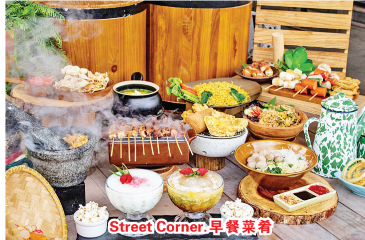
Street Corner 早餐菜肴

公共关系经理 AtikaNurliawati 说,“在健康、安全与卫生(HSH)以及物流方面,我们提供给客人的两个最重要的因素,尤其是 GOCAPAN 套餐,是因