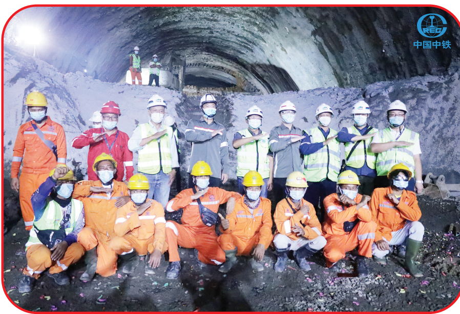
中印尼员工众志成城，防疫抗疫和施工生产两不误

疫情及雨季施工等诸多困难，严格按照设计和规范施工，采用合理的施工工法，守正创新，实现了全隧提前顺利贯通。隧道施工过程中，培养了260名印尼技术工人，为隧道贯通起到了重要作用。