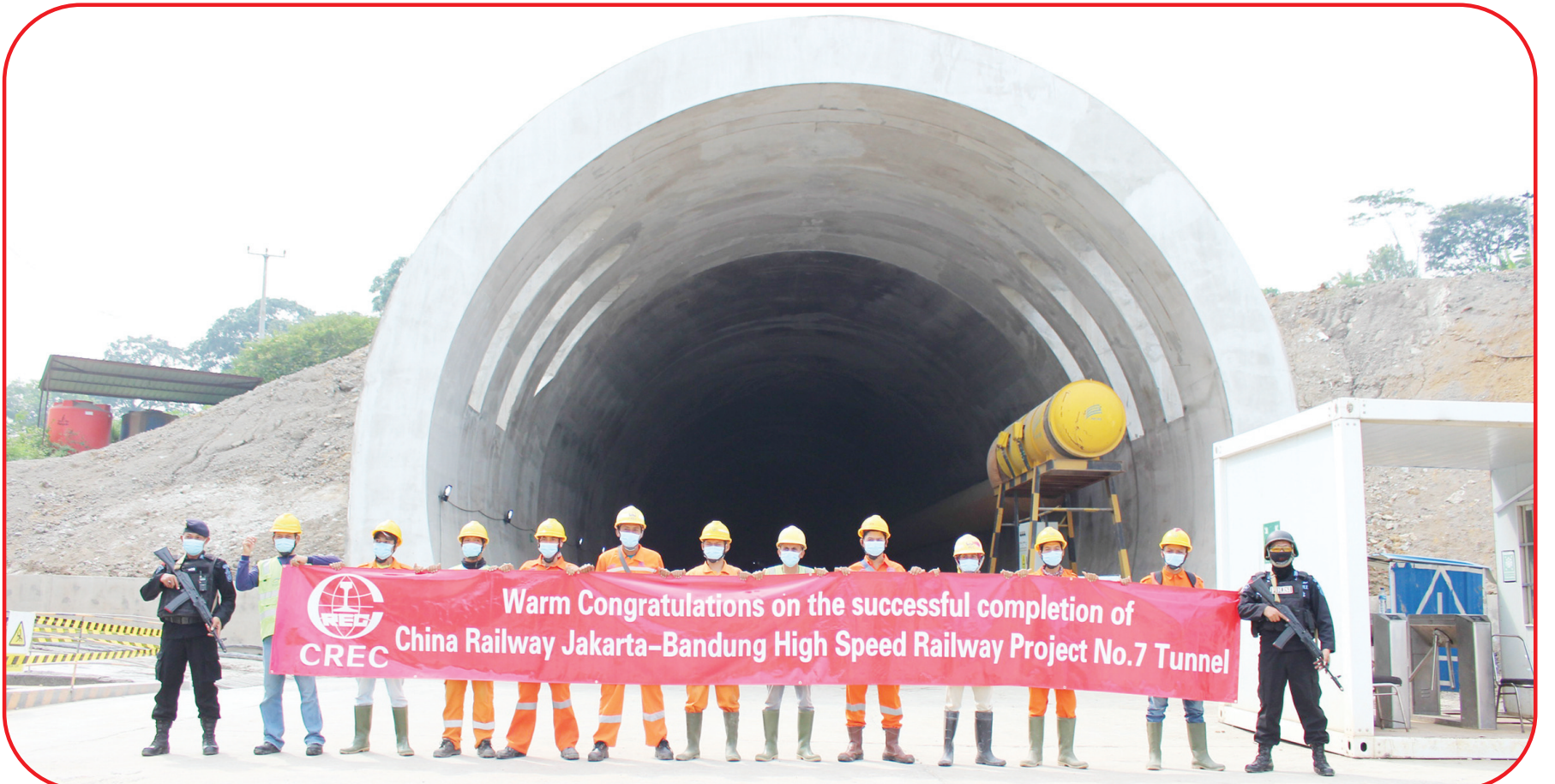
热烈祝贺印尼雅万高铁7号隧道顺利贯通

雅万高铁7号隧道由中国中铁印尼雅万高铁项目经理部一分部中铁三局负责施工，隧道全长1285m，洞身经过处为黏土、泥岩、安山岩，最大埋深77.4m，V级围岩占比80%，30m以下埋深占比93%。自开工建设以来，工程技术人员根据不同地段的特点，采用三台阶临时仰拱开挖法、三台阶临时横撑开挖法、CRD开挖法等多种工法保证施工进度和施工安全，克服浅埋、偏压、进口道路改移、出口洞口滑坡体、新冠