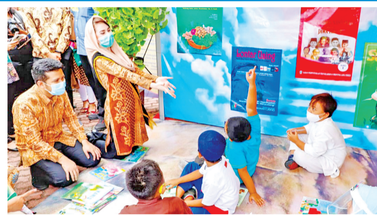
东爪副省长与儿童交流对话

加阅读兴趣，因为阅读可以提高文化水平。东爪副省长夫人、Bunda Baca 读书会负责人亚鲁米女士(Arumi Bachsin)说：“我们所有人都必须具备信息素养和提高阅读能力。因此，要学习新的知识和技能才会轻而易举。为此，我们需要鼓励阅读兴趣，尤其是对儿童的阅读兴趣。阅读是增加知识和信息的基本来源之一。” (Anto-seHK)