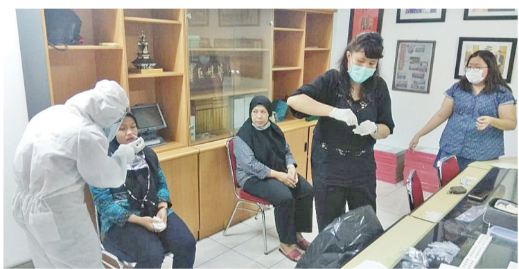
检测在小会议室进行