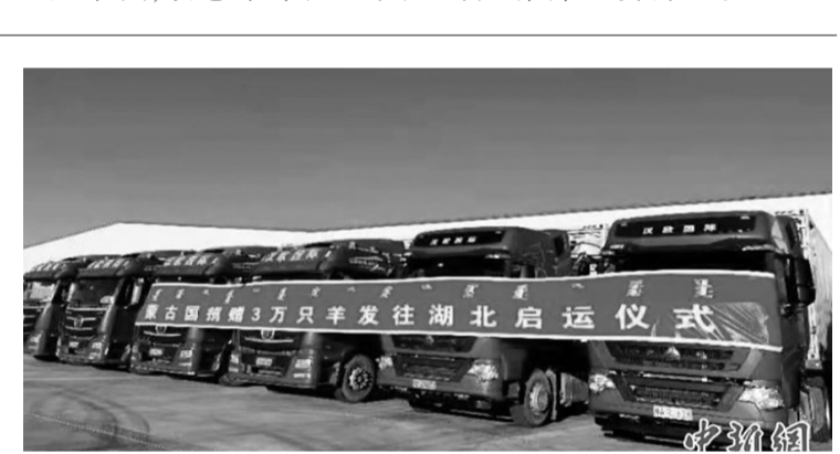
图为整装待发的运输车。

此次接运捐赠羊的任务由武汉汉欧国际物流有限公司承担。接运羊的10台集装箱冷链车11月9日从武汉出发，经过1800公里的长途跋涉，11月11日来到二连浩特市。