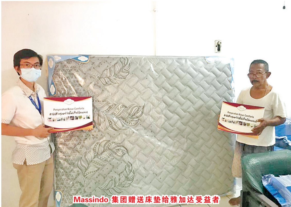
Massindo 集团赠送床垫给雅加达受益者