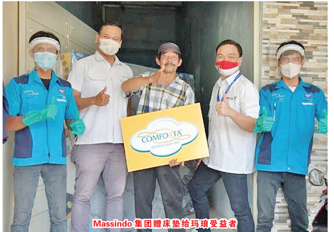
Massindo 集团赠床垫给玛琅受益者

【本报讯】2020年11月10日，在“英雄日”，为纪念英雄们的奉献，Comforta Springbed 为当代英雄们免费提供100张弹簧床垫。