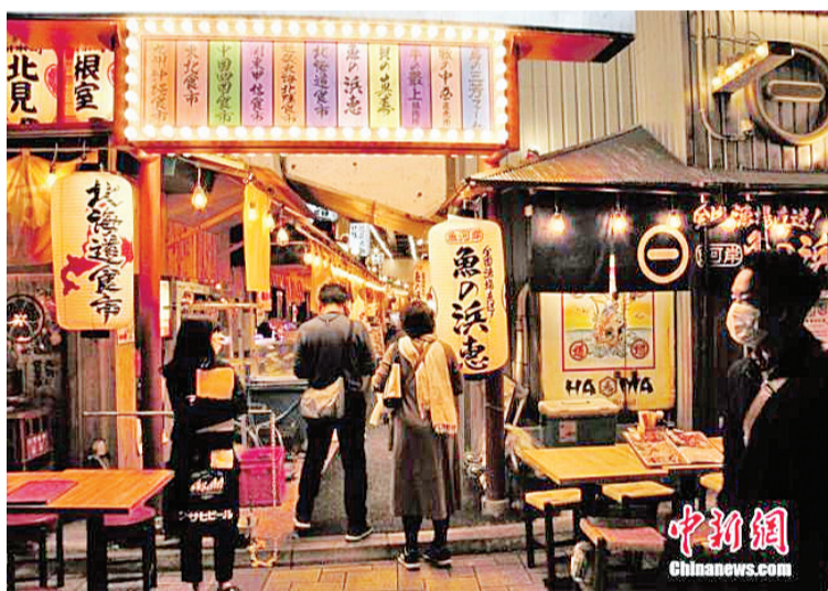
资料图:疫情下的日本。中新社记者 吕少威 摄

据日本放送协会(NHK)9日报道,日本厚生劳动省近日发布的统计数据显示,该国目前已有超过7万人因新冠疫情失业。从行业类别看,制造业的失业人数最多。