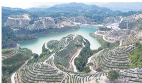
廣東凱達茶業股份有限公司在西岩山東頂湖的茶場

近年來，梅州市各級林業部門認真抓好森林資源培育、保護和發展，大力引導發展以森林公園和自然保護區為依托的森林生態旅遊業，開發各類森林康養產品。目前，平遠縣被國家林草局等四部委認定為國家森林康養基地，韓山省級森林公園等5個單位獲認定為省級森林康養基地（試點）。（李艷良 韓華華）