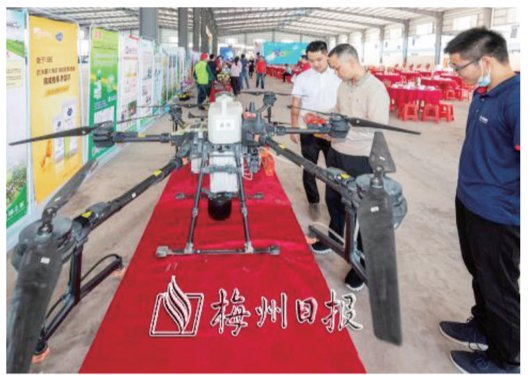
參會人員在了解梅州柚產業相關農資產品。

據了解，此次活動由市農業農村局指導，梅州日報社、梅縣區農業農村局、梅州市志穎農資有限公司聯合主辦，旨在落實市委、市政府關於發展梅州柚產業、打響梅州柚品牌的工作要求，助推實施2020年廣東梅州柚“12221”市場營銷暨品牌建設十大行動計劃，進一步提升梅州柚品質和品牌形象，助力鄉村振興。（吳麗伶）