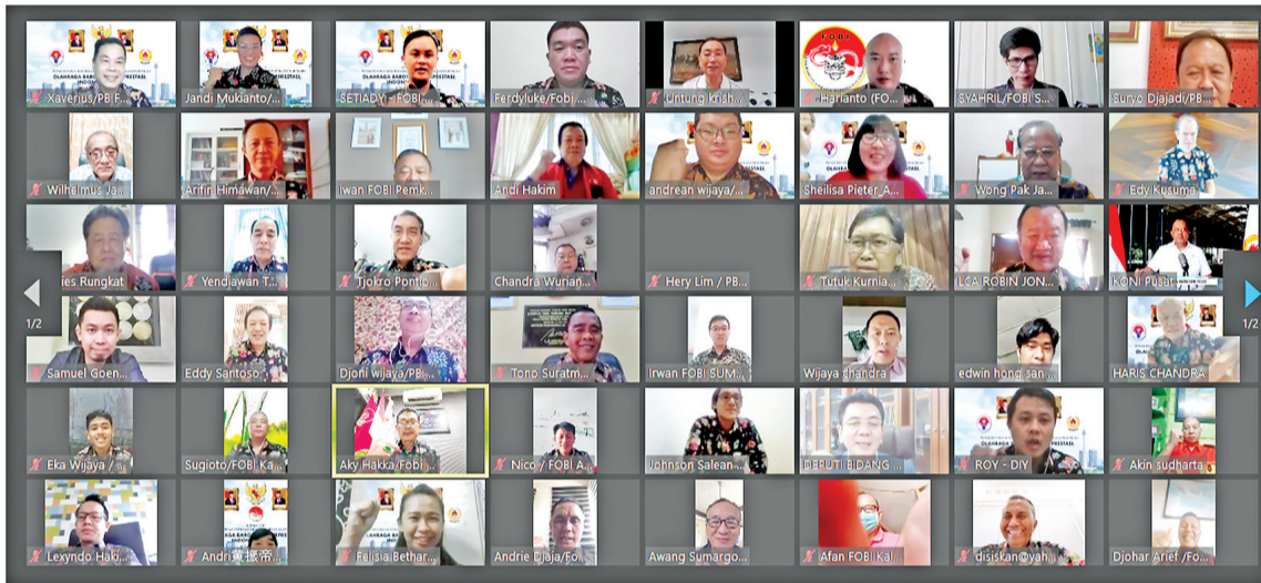
参与视频大会各分会代表