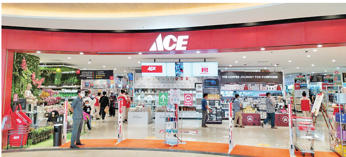
ACE 在 Sentul AEON 商场 2 楼

【本报讯】2020年10月28日，不断扩大规模的长友(Kawan Lama)集团，在西爪哇省茂物县 Sentul MH Thamri 街 AEON Mall 开设 ACE，为最全面的家庭和生活用品五金及家具超级店，及 Pet Kingdom 为提供完善的宠物护理和需求物品超级店。 长友集团市场总监