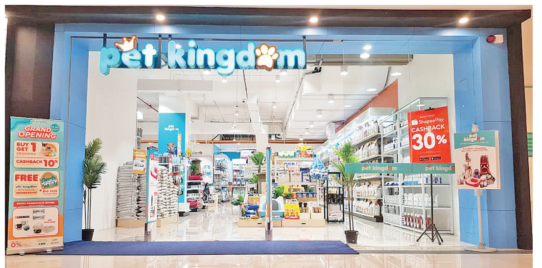
Pet Kingdom 在 AEON 商场 B1 楼

的安全和舒适放在首位。 通过在 AEON Mall 购物中心 Sentul 开设 ACE 五金工具超级店和宠物王国 (PET Kingdom)，希望通过各种优质的产品以及友好而机敏的员工服务，支持茂物县民众的生活方式，并改善他们的生活质量。 ACE 位于 2 楼，提供满足家庭和生活方式需求的