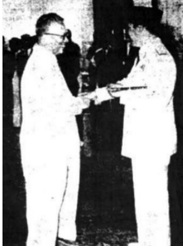
1960年萧玉灿与苏加诺