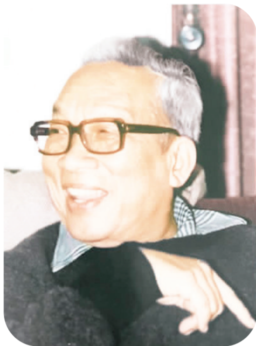
印尼著名的国务活动家、政治家、思想家萧玉灿

我是印度尼西亚著名华人社会政治活动家萧玉灿的长女，父母都是在荷兰人办的学校上的学。