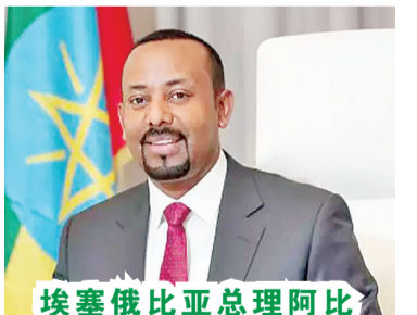
埃塞俄比亚总理阿比

据埃塞俄比亚人权委员会2日提供的信息,袭击事件发生在1日,主要针对居住在奥罗米亚州的阿姆哈拉族人。超过60名袭击者将阿姆哈拉族