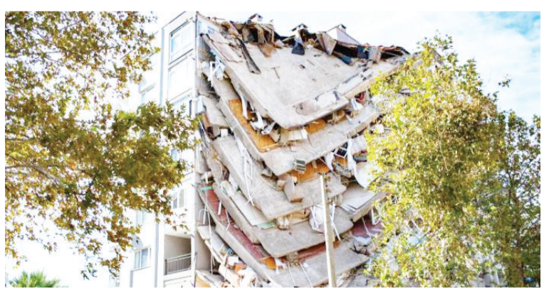
当地时间10月30日,爱琴海海域发生强震,波及希腊与土耳其部分地区。图为土耳其地震受灾地区被损毁的建筑。

100人遇难,近1000人受伤。此外,希腊萨摩斯岛的两名青少年也在地震中丧生。土耳其位于地震多发带。1999年,土耳其西北部地区连续发生两次7级以上地震,造成1.8万人死亡。2011年,土耳其东部凡省发生7.2级地震,造成644人死亡。今年1月,土耳其东部埃拉泽省发生6.5级地震,造成数十人死亡。