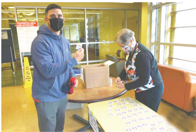
当地时间10月31日,弗吉尼亚州迎来美国2020年大选提前投票的最后一天。图为弗吉尼亚州阿灵顿的一处提前投票站,一位完成投票的选民。