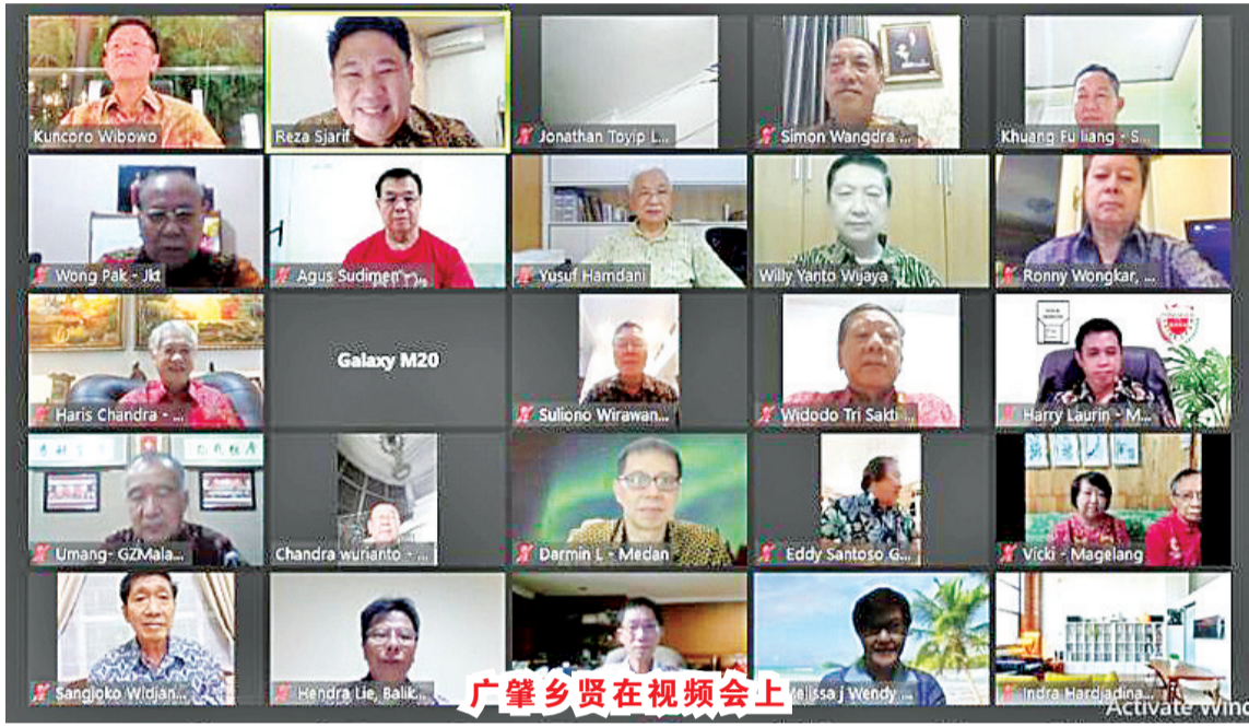
广肇乡贤在视频会上