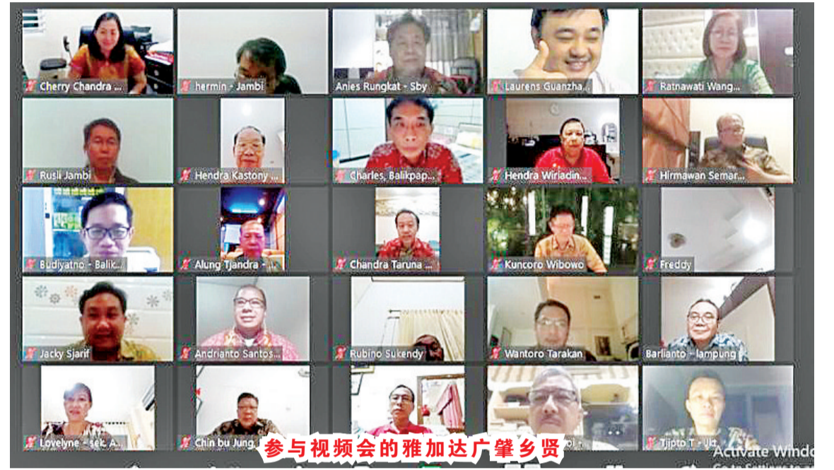
参与视频会的雅加达广肇乡贤