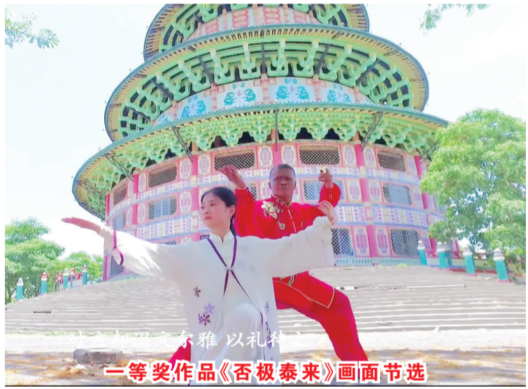
一等奖作品《否极泰来》画面节选