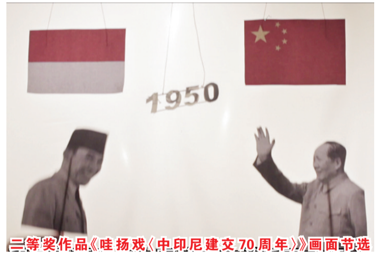
三等奖作品《哇扬戏〈中印尼建交70周年〉》画面节选

【本报讯】据中国驻印尼使馆消息：为庆祝中印尼建交70周年，驻印尼使馆与印尼外交政策协会于9月至11月联合举办以“新时代的中印尼故事”为主题的短视频大赛。经过1个多月的征集评选，11月2日大赛颁奖仪式在线举行，肖千大使、印尼外交政策协会创始人、印尼前副外长迪诺大使和21名大赛获奖者代表出席。 肖千大使在致辞中表示，本次短视频大赛以“新时代的中印尼故事”为题，得到印尼朋友们的踊跃参与。在征集到的400余件作品中，来自印尼各地的创作者们用独具一格的视角与精彩灵动的镜头，讲