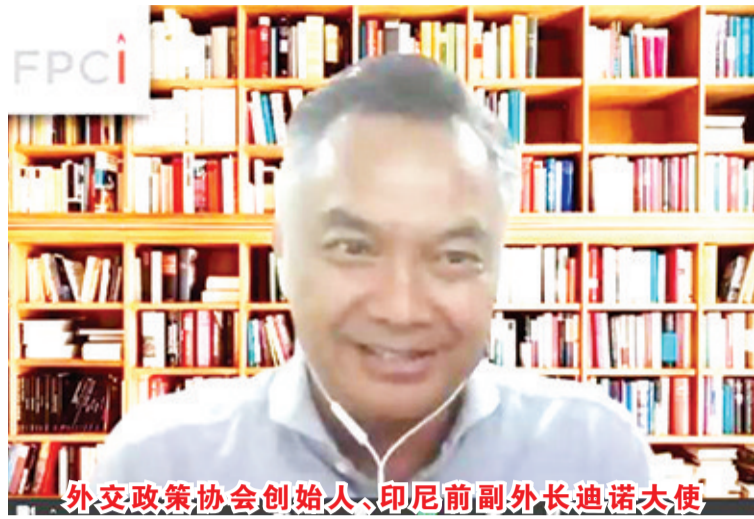
外交政策协会创始人、印尼前副外长迪诺大使