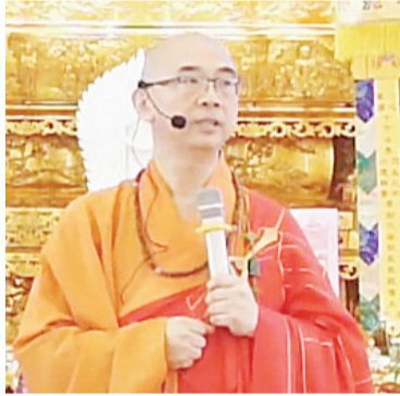
第二天举行修建慈悲准提寶忏

【本报讯】加里曼丹是印尼物产最丰富的宝岛，有五个省形成了在东南亚最大的岛屿。千年来未听过有地震、风灾，向全世界出口棕榈油以及橡胶。坤甸是西加里曼丹首府。大丛山去年12月初举行殿宇修建完成圣像安座大典，礼请超过百位三大语系僧伽来自十六