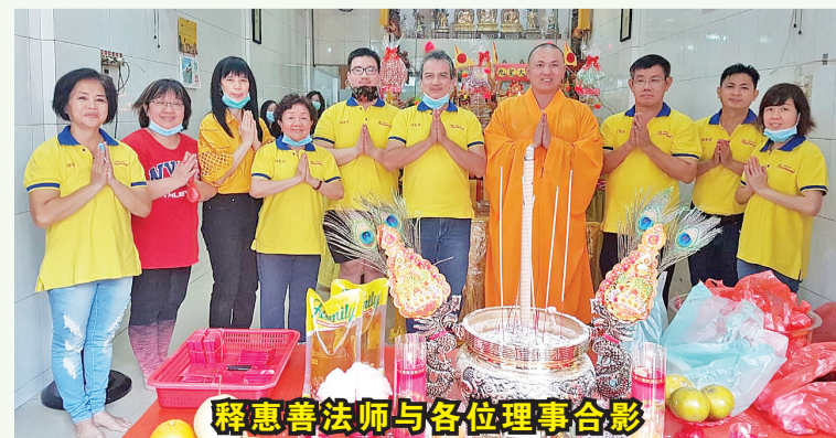
释惠善法师与各位理事合影