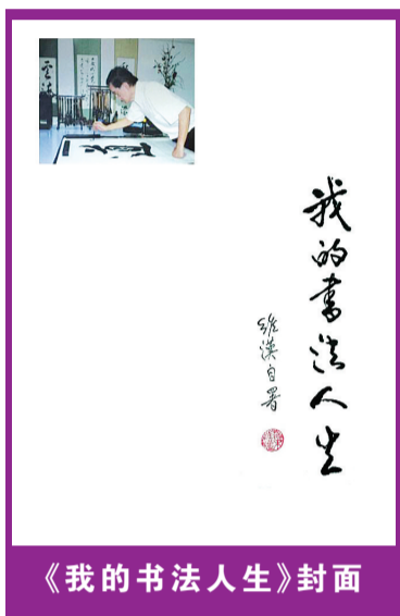
《我的书法人生》封面

【本报讯】我国著名书法家叶维汉老师《我的书法人生》一书问世，引起书法界同道、各界人士的极大共鸣及热烈反响。该专辑共127页，荟萃了叶老师部分书法作品，以及和国内外政要、知名人士、亲朋好友的来往书信，是叶老师一生的写照。