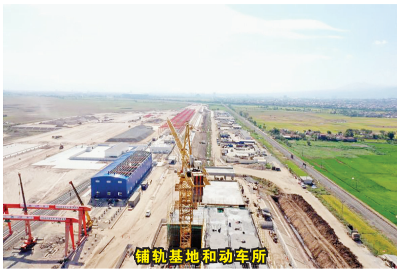
铺轨基地和动车所