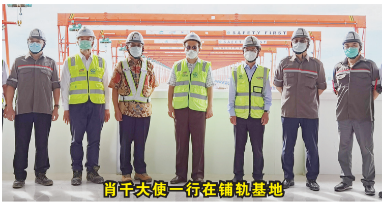
肖千大使一行在铺轨基地

做好防疫和项目建设。肖千大使充分肯定雅万高铁项目取得的进展成绩，要求企业进一步优化施工组织，加强协调配合，加快推进施工建设。肖大使还介绍了当前印尼疫情形势，要求企业继续将疫情防控作为首要任务，克服麻痹思想和松劲心态，严格落实防疫要求，加强对员工关怀