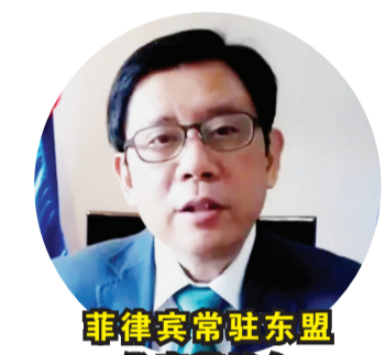
菲律宾常驻东盟代表诺埃尔