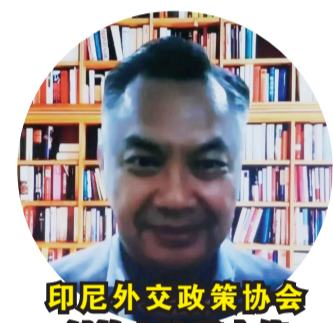
印尼外交政策协会创始人迪诺大使

指明合作方向。双方共推复工复产，开通“快速通道”和“绿色通道”，稳定地区产业链、供应链，增添地区动能。双方保持经贸合作韧性，贸易和投资逆势上扬，东盟成为中国最大贸易伙伴，中国对东盟国家直接投资同比增长76.6%。双方共同推进高质量“一带一路”建设，重点基建项目不断取得新进展，助力当地经济复苏。