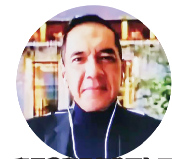
印尼前贸易部长瓦加万