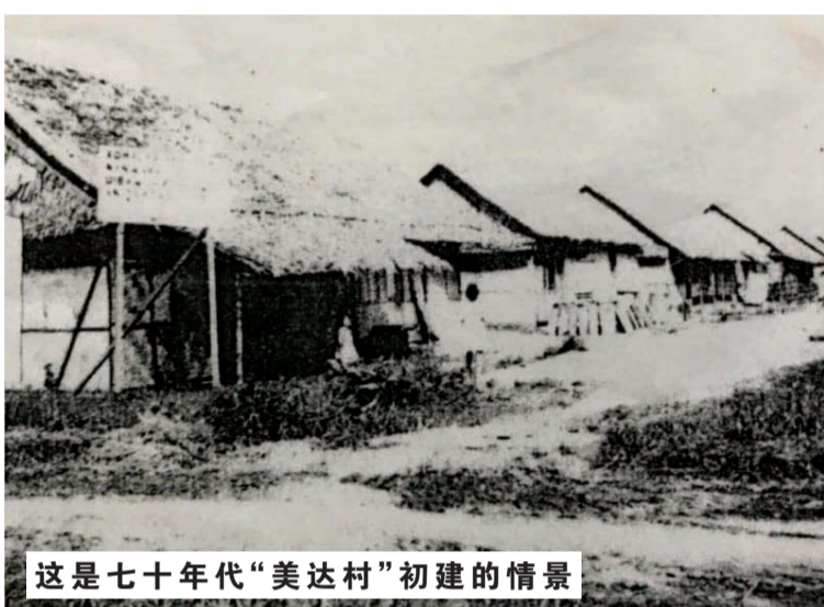
这是七十年代“美达村”初建的情景

大烟寮母亲!您是历史的见证者!您亲眼目睹亚齐难侨儿女在您怀里英勇斗争的事迹。他们用血汗谱写了反逼害争生存的动人篇章,应由您作证!儿女向世人传递!