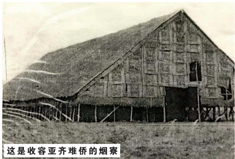
这是收容亚齐难侨的烟寮