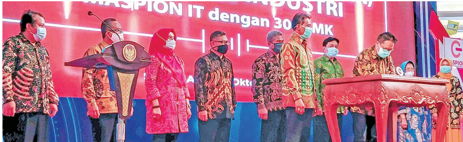
东爪哇多间职业专学校在签署备忘录现场