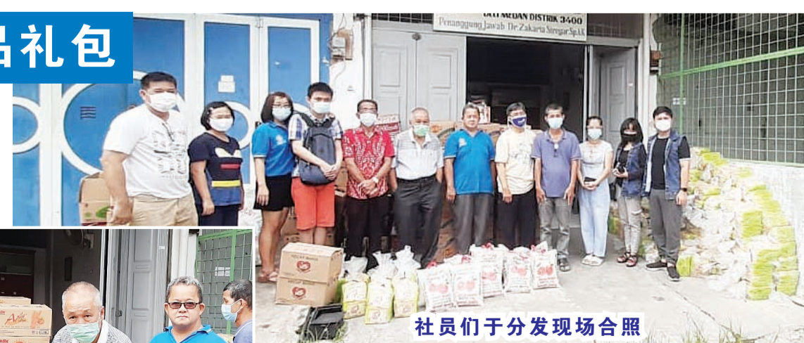
社员们于分发现场合照

称,为解决温饱问题,济助对象以不分种族宗教信仰,一视同仁,完成善举。此次所分发的日常物品计有白米、煎油、酱油、米