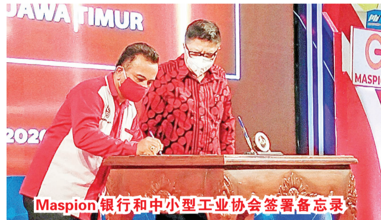
Maspion 银行和中小型工业协会签署备忘录