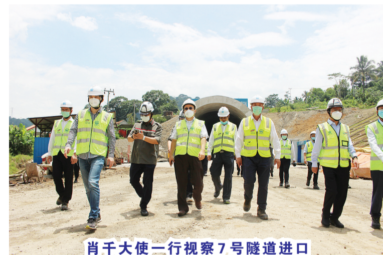
肖千大使一行视察7号隧道进口

印尼当地时间2020年10月30日上午11时，中国驻印尼大使肖千在印尼雅万高铁项目KCIC中方董事辛学忠、印尼雅万高铁项目中方联合体指挥长肖领新、中国中铁印尼雅万高铁项目