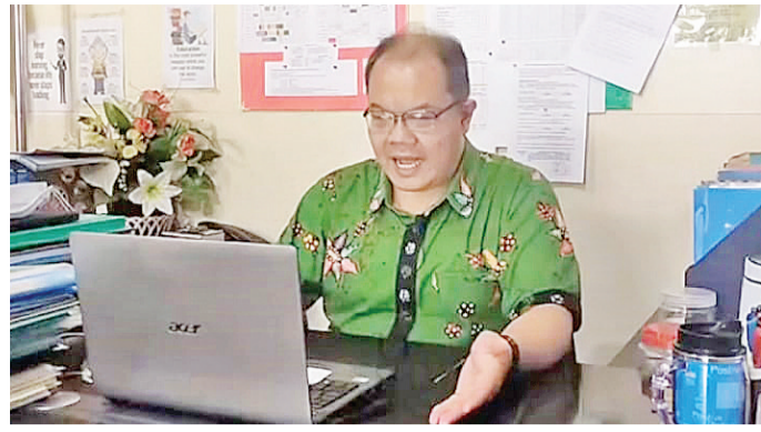
Max校长表示,希望同学们收看网络发布的这些信息,并诚邀学生家长一起收看。 本报记者幸舟报道

隆劲松三语学校的宗旨及其教学内容。于10月26日,27日,28日依次以汉语、英语、印尼语举办各项比赛,以达到正确掌握此三语的词汇、语法,顺利地进行交流交际的目的。 10月28日一并举行“印尼青年誓词节”庆祝活动,宣讲其要旨:一个印度尼西亚国土,一个印度尼西亚民族,一种印度尼西亚