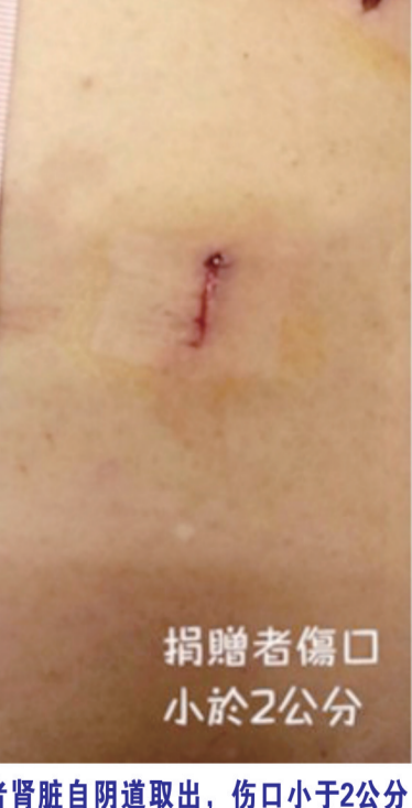
捐赠者伤口 小于2公分

于未来无生育计划的妇女，我们甚至可以从阴道将肾脏取出后进行肾脏移植手术，可以缩小肚子的伤口，且多数病人阴道的伤口也不会有明显的疼痛。接受此种手术的病人，不但伤口小，恢复期缩短，感染率也不会增加，存活率更不受影响，满意度十分良好。嘉义长庚医院肾脏移植病人五年的存活率可以高达95%，可说是优于欧美先进国家。