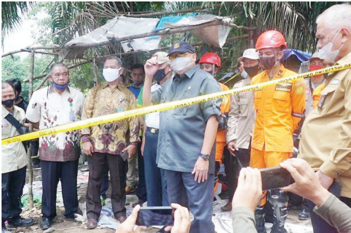
印尼官员在现场要求当地政府应立即制止非法采矿活动

众保持警惕，并为可能发生的洪水、滑坡以及强风等水文气象灾害做好准备。 印尼大部分地区属热带雨林气候，目前正进入雨季，雨季期间常出现强降雨天气，山洪、滑坡以及洪涝等灾害多发。