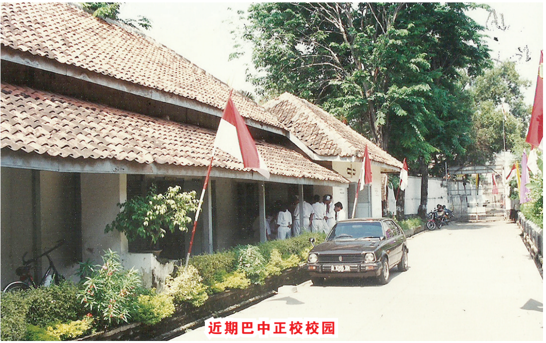
近期巴中正校校园