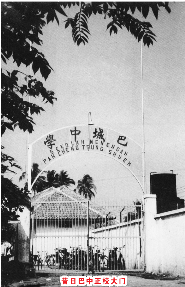
昔日巴中正校大门

10月15日,联合中学在还没有自己校舍的情况下,假广仁学校举行这个有800余名师生员工参加的激动人心的开学典礼。于是战后一所新的华侨中等学校正式诞生了,而这一值得纪念的日子以后便被定为巴城中学的校庆日。联合中学创办伊始即录取了717名学生,计编初中一年级7班、二年级4班、三年级1班、高中一年级1班,另开一高中特别班,以适应学生回国升学或走向社会就业等的特殊需要。后来,为了满足从外地闻风而来的求