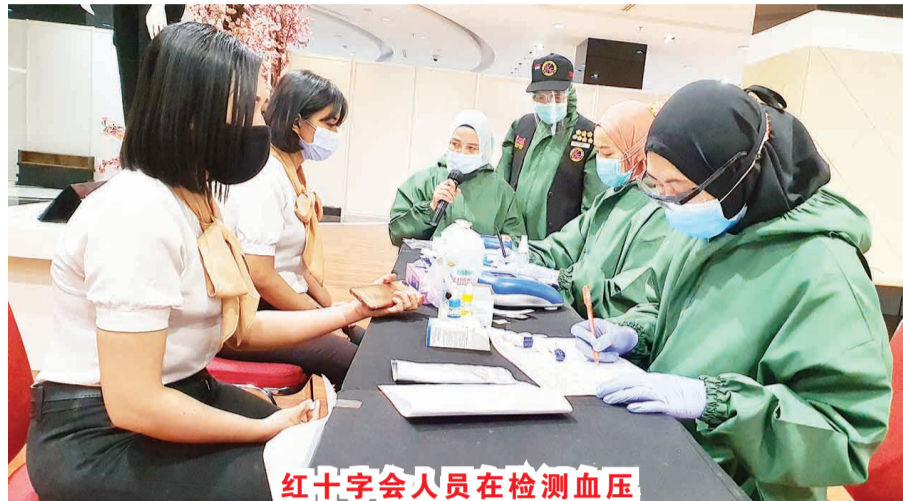
红十字会人员在检测血压