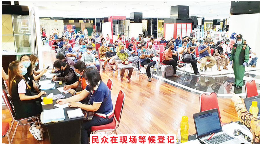
民众在现场等候登记