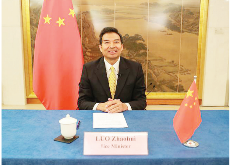
LUO Zhaohui Vice Minister

中新社雅加达10月20日电(记者林永传)由中国驻东盟使团与菲律宾常驻东盟使团、东盟秘书处、中国国家留学基金委共同举办的中国-东盟菁英奖学金2020学年开学仪式20日通过视频方式举行。