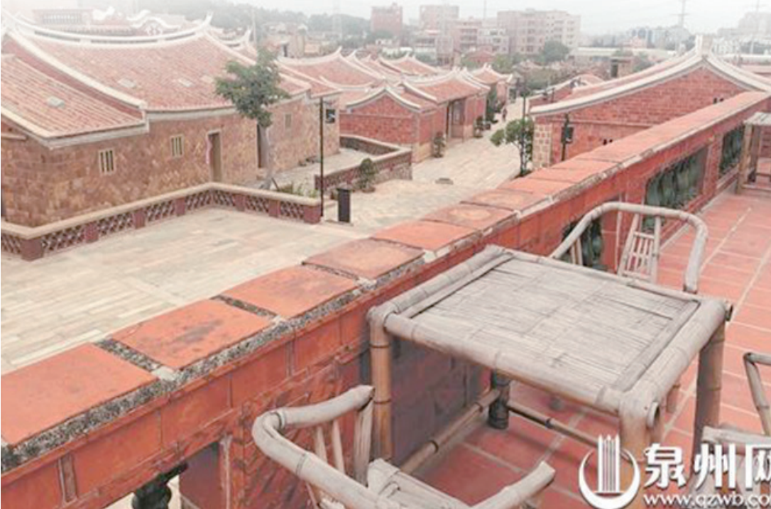
随着首期古民居修復工作的完成，位于石獅市靈秀鎮的中國傳統村落——華山村，風貌重現、氣質卓然。（謝曦 攝）

雕梁飛檐、紅磚白脊，秋日裏的華山村古厝群，掩映在青山綠野間，令人驚艷。随着首期古民居修復工作完成，這個位于石獅市靈秀鎮的中國傳統村落，風貌重現、氣質卓然。