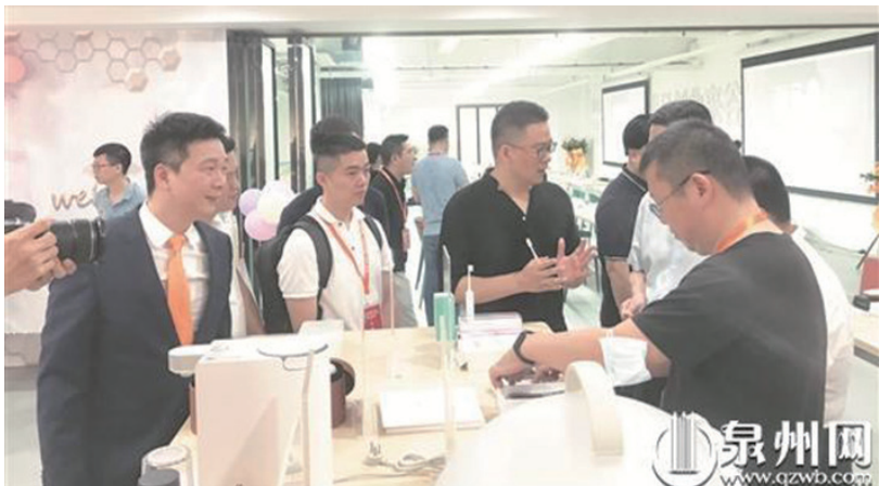
優秀的產品吸引業界人士關注