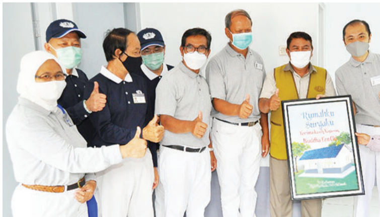
援建计划受惠者的欢喜，也成为志工的法喜