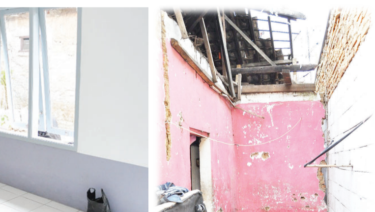
艾丽家的旧厨房没有屋顶