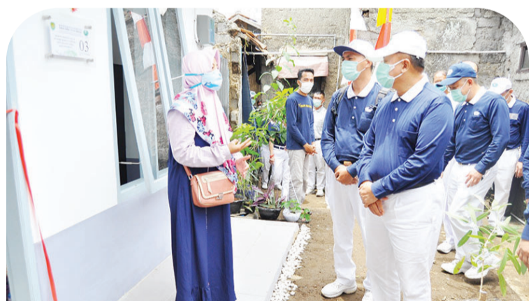
志工来到援建计划受惠者的新房子与居民地互动