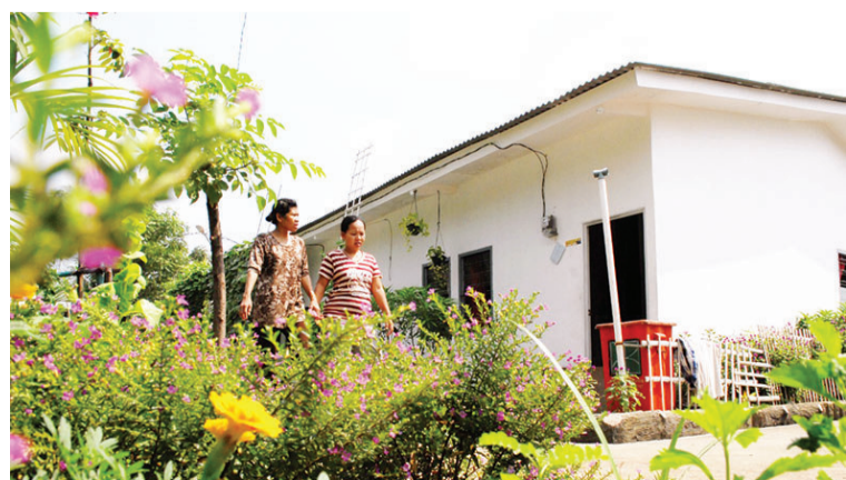
援建计划受惠者的欢喜，也成为志工的法喜