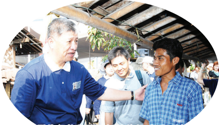
印尼副执行长郭再源(左)访视时，与后村(Kampung Belakang)居民互动。