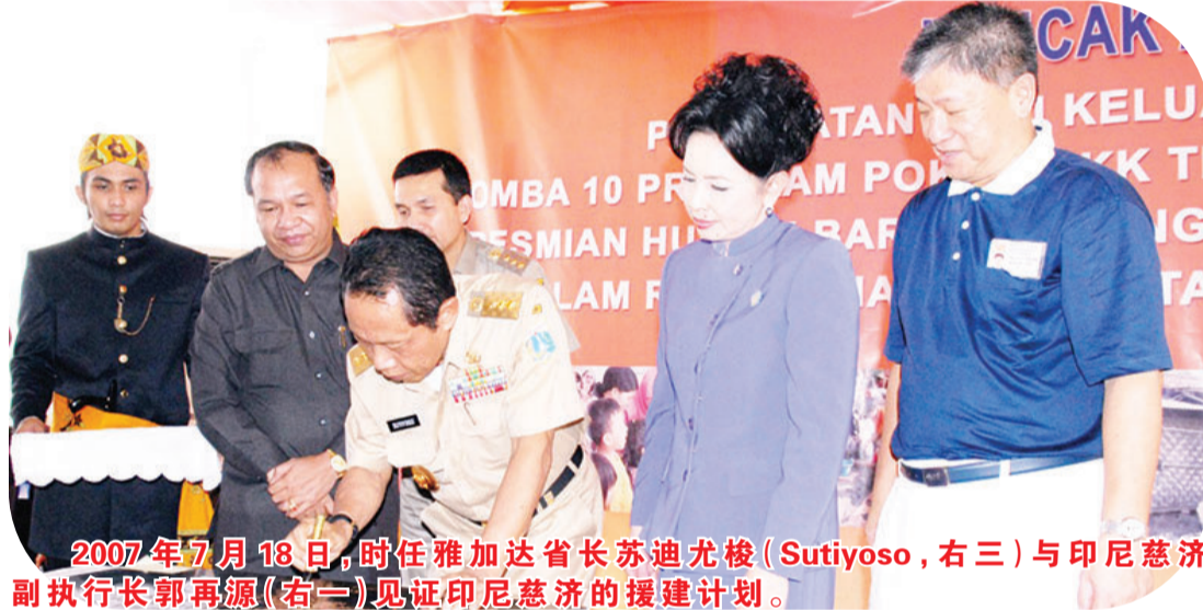
2007年7月18日，时任雅加达省长苏迪尤梭(Sutiyoso, 右三)与印尼慈济副执行长郭再源(右一)见证印尼慈济的援建计划。