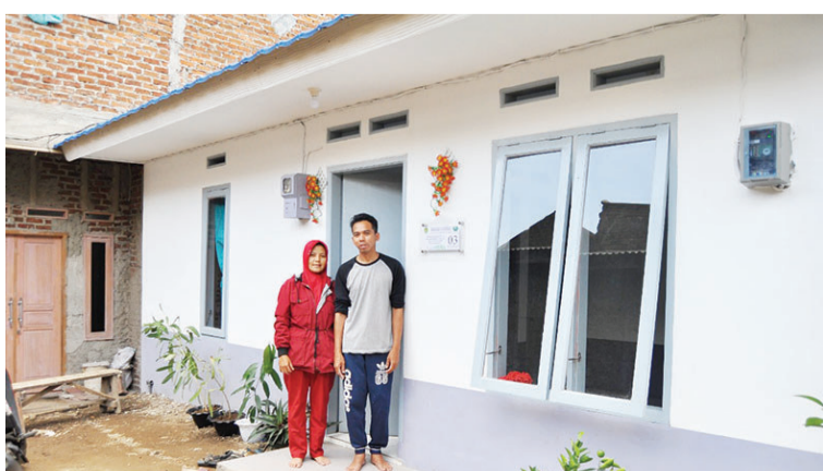
援建计划受惠者的欢喜，也成为志工的法喜