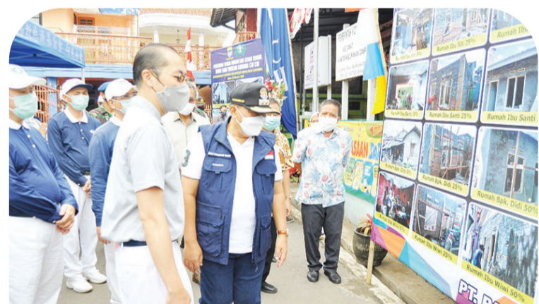
万隆市长奥德观看志工之前在万隆完成的援建计划