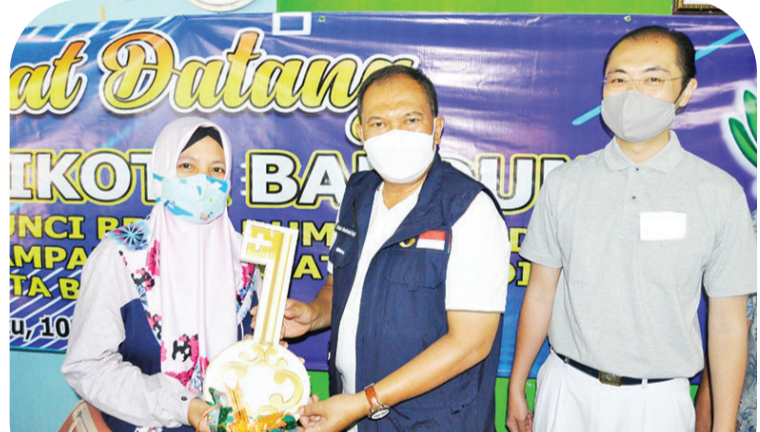
万隆市长奥德(中)把房子钥匙交给一位援建计划受惠者