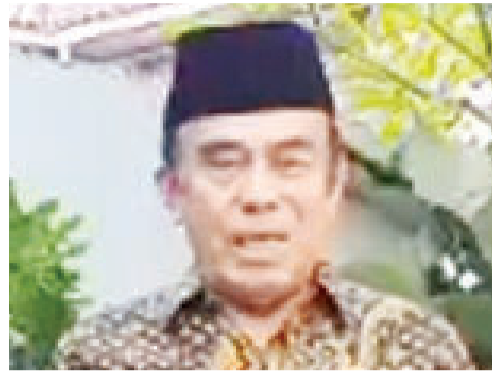
宗教部长 Fachrul Razi 致辞