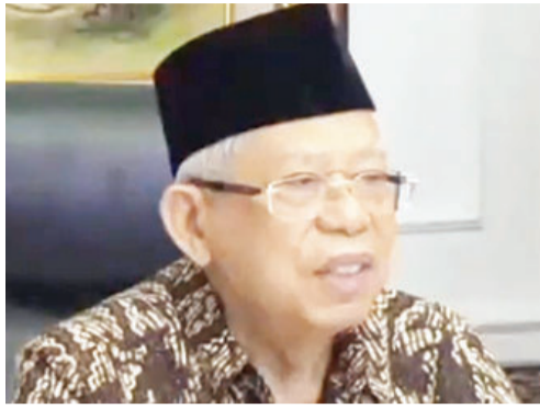
副总统马鲁夫致辞