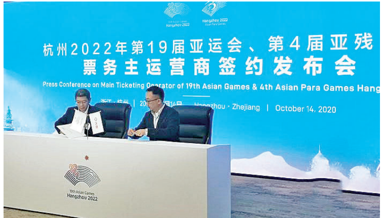
发布会现场。

中新网杭州电14日,杭州2022年第19届亚运会、第4届亚残运会票务主运营商报发布会在杭州举行。记者了解到,杭州亚运会官方票务网站将于2021年上线公开发售门票。票务官网将结合区块链技术实现所有门票上链,让票务运营数字化有效解决假票问题,实现保真验真。