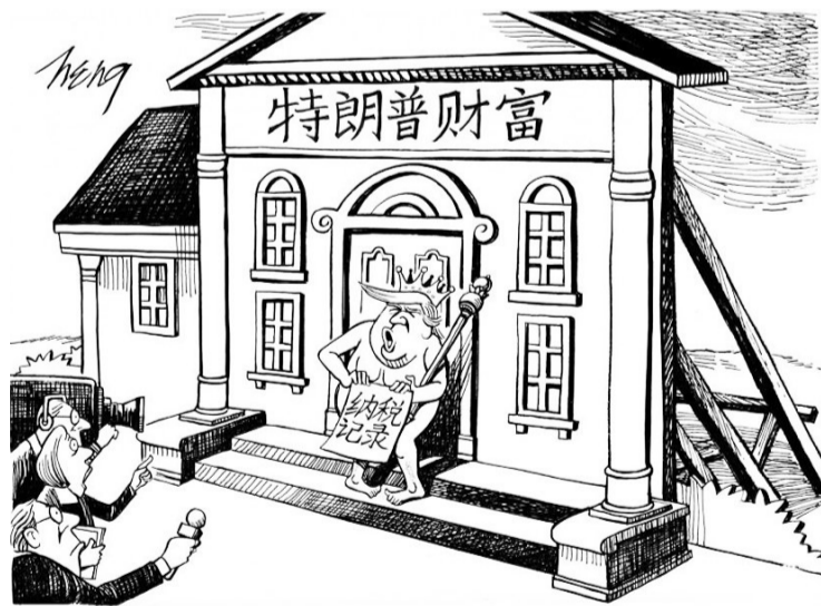
漫画 王锦松(原载《联合早报》)