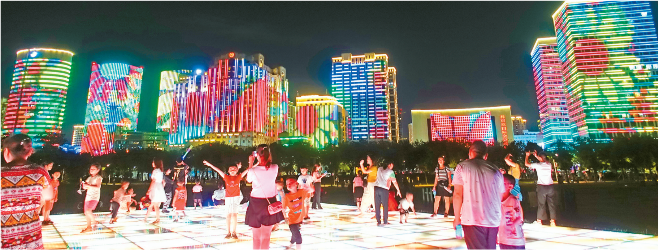
↑時代廣場燈光秀流光溢彩。