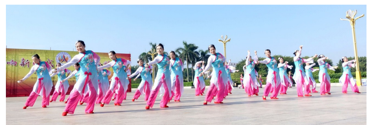
↑參加廣場舞比賽的“汕頭大媽”。