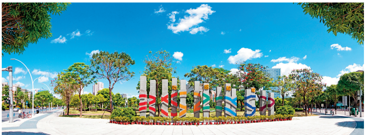
↑拆牆透綠,讓市民盡享環境之美。