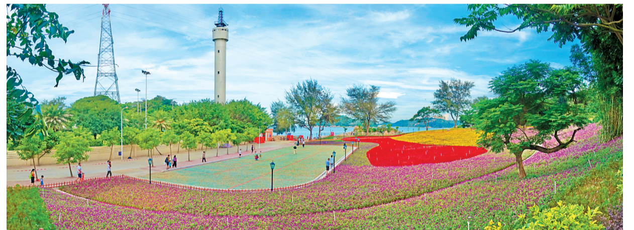
↑姹紫嫣紅的媽嶼島花海。