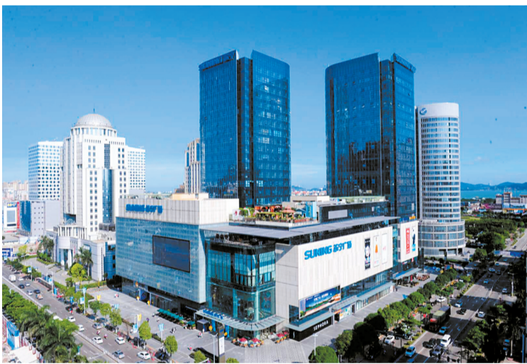
↑一批大型商業綜合體拔地而起,為汕頭這座“百載商埠”更添生機與活力。