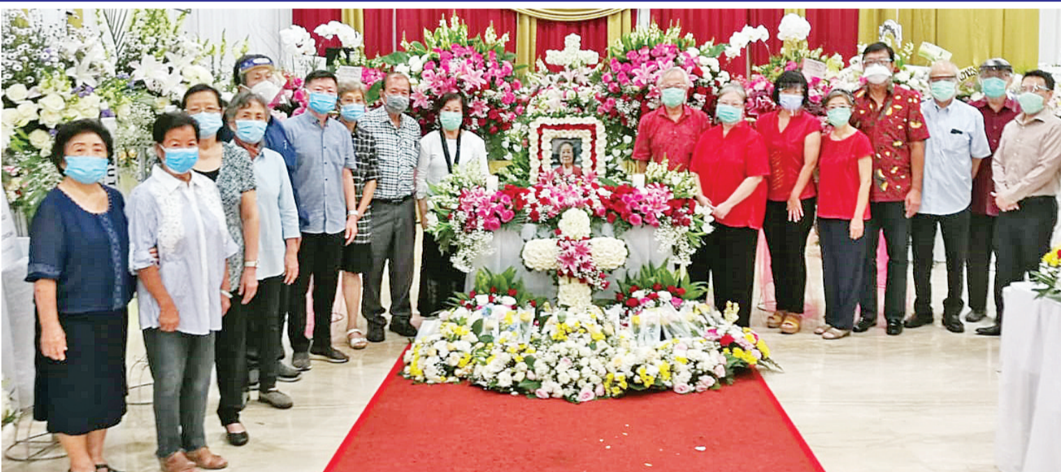
林府家属与巴中校友及老师们合影

如今林老师不声不响的走了,东方痛失良师。林老师一向为人低调,不表彰自己的功劳。东方来不及向您道谢,千言万语道不尽您的贡献,您对东方功不可没,东方将永远怀念您的功劳和奉献!您悄悄的走了,愿您一路走好,荣归天国!