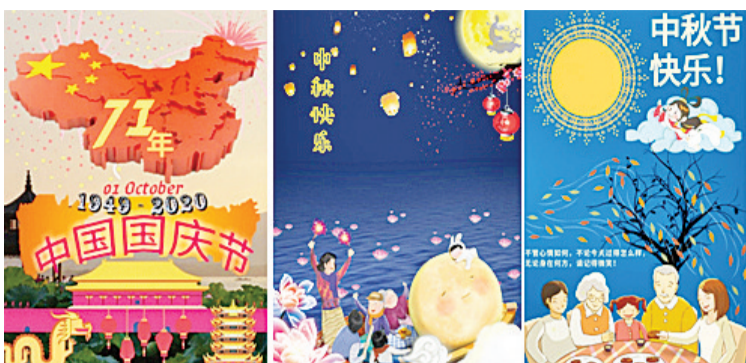
海报比赛第一名、第二名和第三名的作品