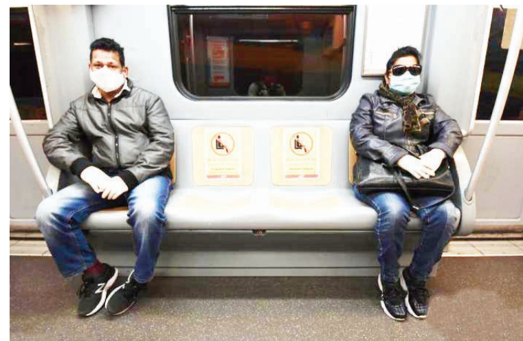
图为贴上安全距离标识的意大利罗马的地铁。

利目前是欧洲控制疫情最好的国家之一,但疫情也在持续恶化,绝不可掉以轻心。在努力避免实施大规模封锁措施的同时,必须保持中央和地方政府对疫情防控工作的干预,从而做好疫情防控,保障民众的健康安全。