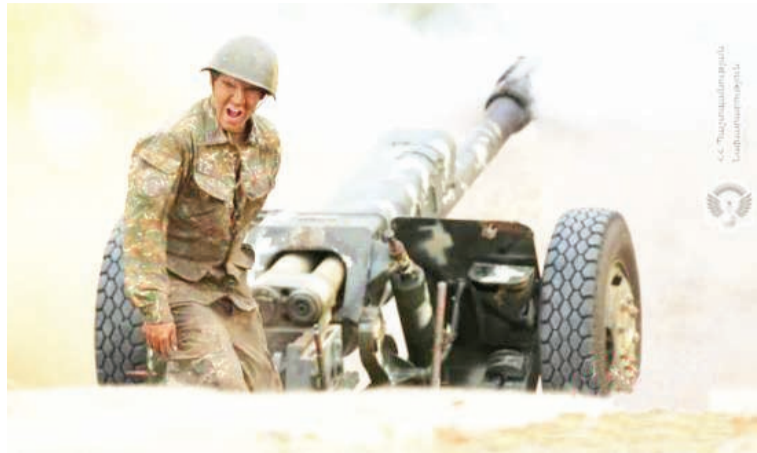
当地时间9月29日,亚美尼亚国防部发布的一组前线照片中,士兵正在发射炮弹。

10月1日,亚美尼亚和阿塞拜疆在纳卡地区新一轮冲突进入第五天,双方部队进行激烈炮击,伤亡人数进一步上升。