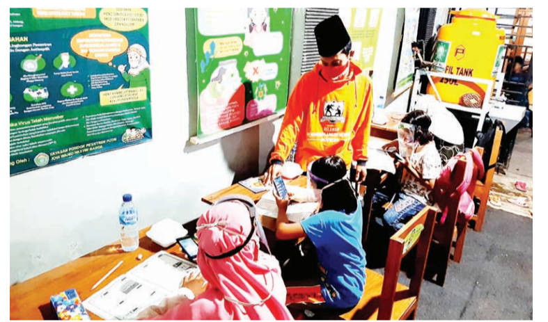
LBPI NU Bangil 学生学习情景