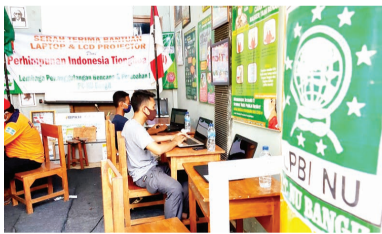
捐赠的笔记本电脑当即开始使用