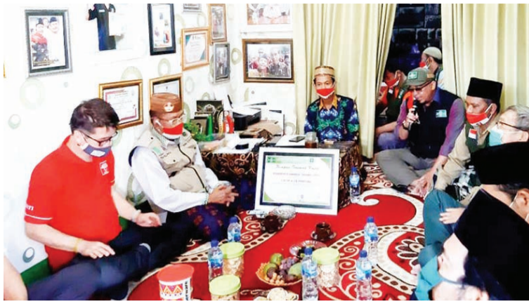
Gusdurian 和 LBPI NU Bangil 负责人在接见时祈祷

【本报讯】2020年9月30日下午，印尼华裔总会(INTI)东爪分会领导在Pasuruan县，向NU灾害管理和气候变化研究所(LBPI NU) Bangil支会，捐赠4台笔记本电脑和投影仪。