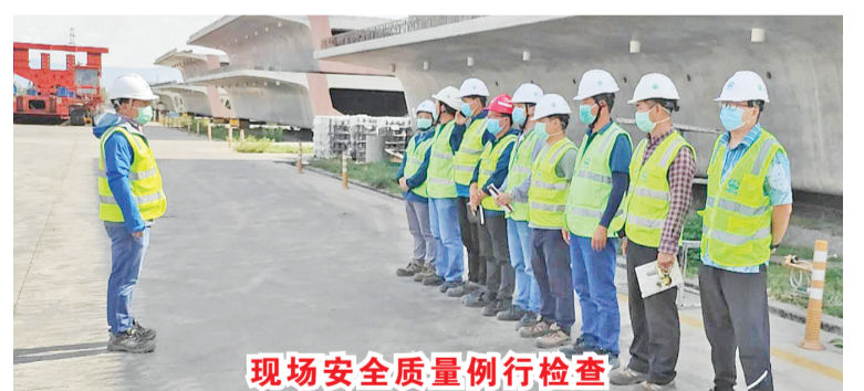
现场安全质量例行检查