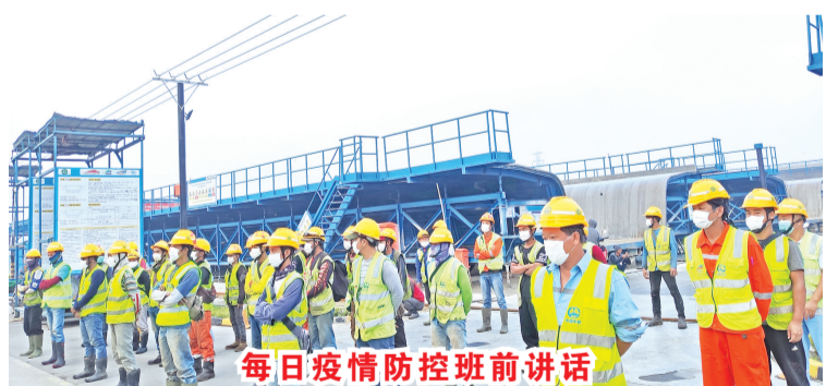
每日疫情防控班前讲话