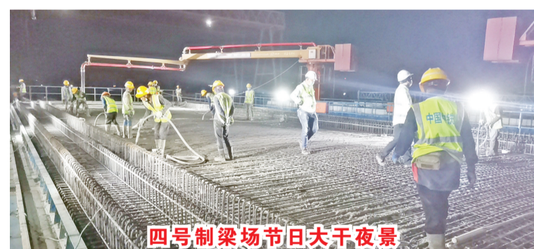
四号制梁场节日大干夜景