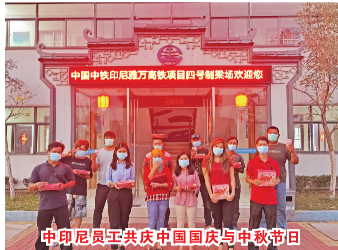
中印尼员工共庆中国国庆与中秋节