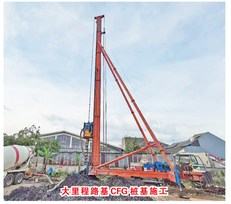
大里程路基CFG桩基施工