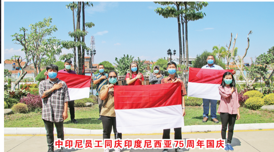
中印尼员工同庆印度尼西亚75周年国庆