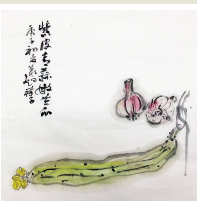
题画 紫皮青蒜嫩黄瓜，细雨斜风忆岁华。舌底不存欺瞒意，小园风味即生涯。