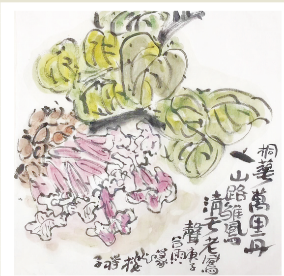
桐花殿春 每过清明想桐花，掩映山居紫气除。谷雨雨绵花半落，树梢树底梦还家。