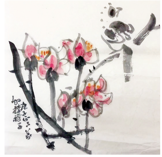
28日，隔窗看玉兰。小雨中，灿然一树，如对静物。暮然，一片花瓣，枝头坠落，旋旋而下。即目一首记之：满目晶莹似玉裁，疏枝不律梦花开。风轻雨细疑云滞，一瓣忽辞落绿苔。(注：不律，毛笔。玉兰又名木笔。)