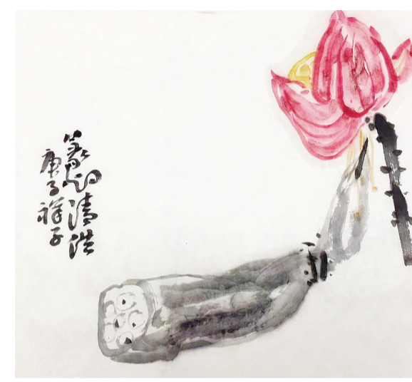
庚子早春，域外有援华物资抗疫者，附唐人诗句：“青山一道同云雨，明月何曾是两乡”，有感而作：水生骨肉怜生心，风月同天香满衾。虽隔寒窗意萧瑟，春芽总破冻泥沉。