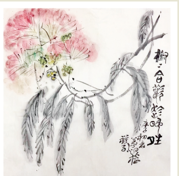
科大花园，合欢暮开，楼楼皆树，碧浪排烟，接榴并，夏花有续焉。《本草拾遗》云：小叶两列，日暮相叠如睡，及朝，又渐分离，故有合欢、夜合之名：香气无端弥四极，高台碧浪浮丹纒。春情已了谁倾诉？叶合花迷趁晚晴。