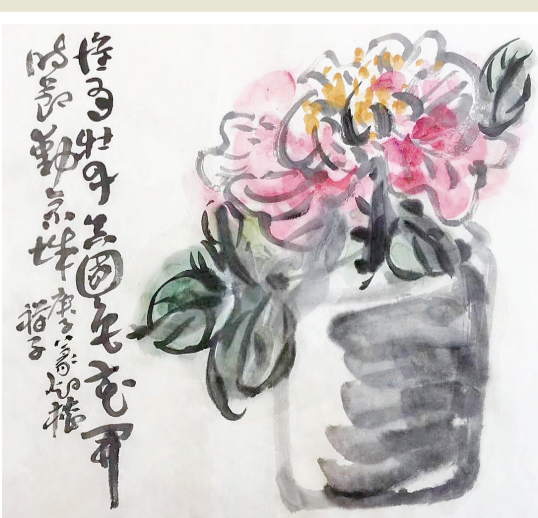
牡丹 曾从小史评天香，魏紫姚黄倾国狂。每想清心能称意，一团水墨失花王。