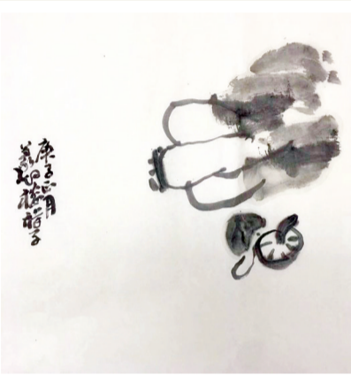
雪里青菜 三月不知肉味可，三餐断无此物难。短筐长镜归园圃，雪压霜欺味始甘。