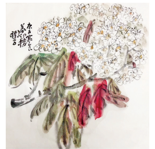
庚子寒食： 改火谁知续旧谈？柳风旣径接晴岚。三家桃李才飘落，堆雪一墙开石楠。