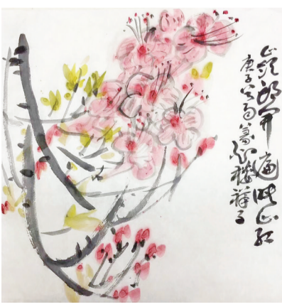
大别山杜鹃花 谁是春花最胜军？高岗绝壁动流云。多少子规声唤里，映山红遍醉芳薰。