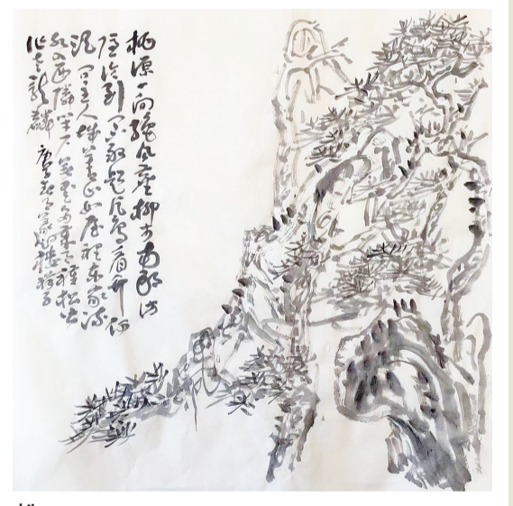
松： 植中松柏人中龍，历劫冰霜意志浓。不得鸿蒙传一画，难从皮相溯希踪。