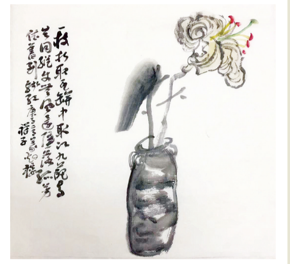
百合花 一枝折取瓦瓶中，取次九葩与共同。纵使无风还堕落，孤芳依旧到残红。