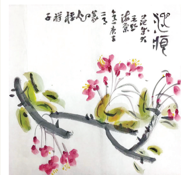
庚子记花时： 木笔委地小桃芳，春光跳脱到海棠。丝丝缕缕无穷意，可惜心痕多感伤。