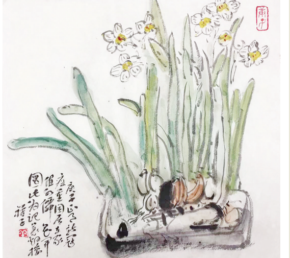
水仙 茎似璚琳叶翠条，花开还比柔奴娇。谁人能共清如许？只傍寒泉度寂寥。