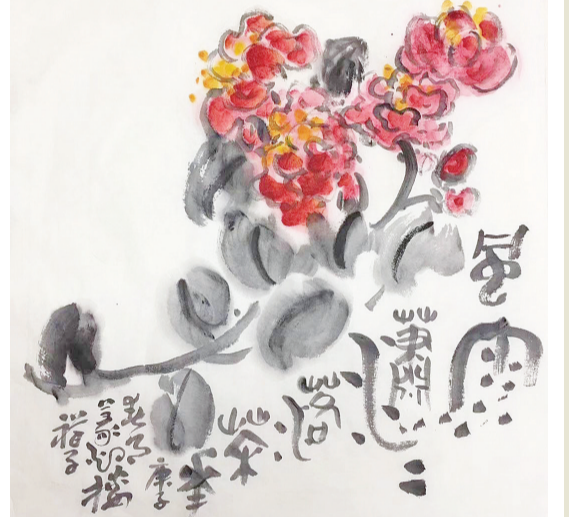
朱淑真《春半》句：“已近清明节，初过上巳时”，今又春半，惊心动魄：苟芒吹泪到天涯，金母还挥桃木叉。赖有嘘呵频入夜，潇潇春雨湿重花。