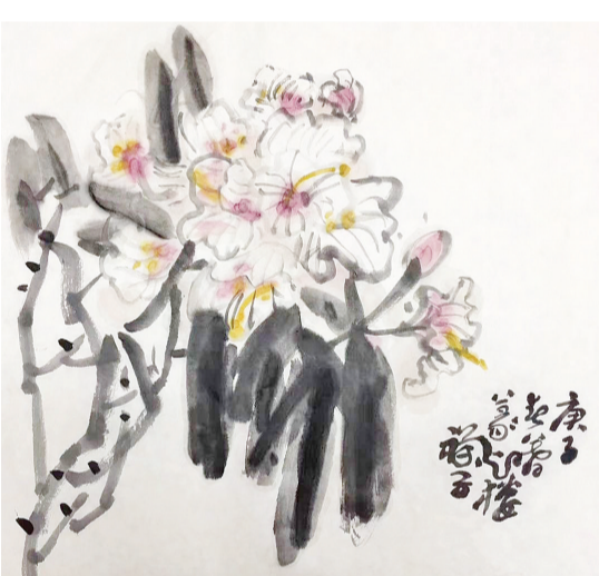
天台杜鹃，又名山踯躅，大树高花。农舍前见一株只三尺余。主人告予，高山移来，随宅再迁，已近三十年，春末敷花淡紫色：天台踯躅落山家，卅载风霜数尺斜。玉蕊紫葩珍重甚，柴门掩映事繁华。