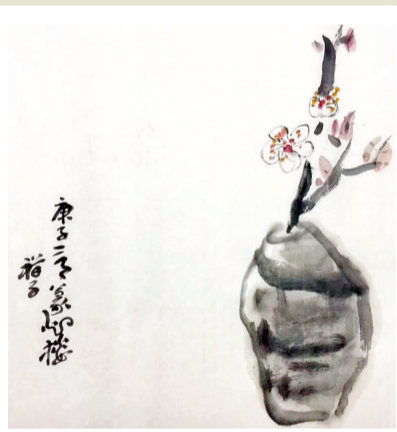
春梦山行： 紫李已落前溪雨，木笔犹开后涧云。二十四番花信日，从今数去更颠君。