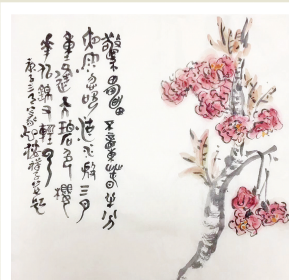
雨后赏樱题画： 惊雷不动春半分，夜雨忽吹湖水般。三月重逢天碧色，樱花似锦又轻云。