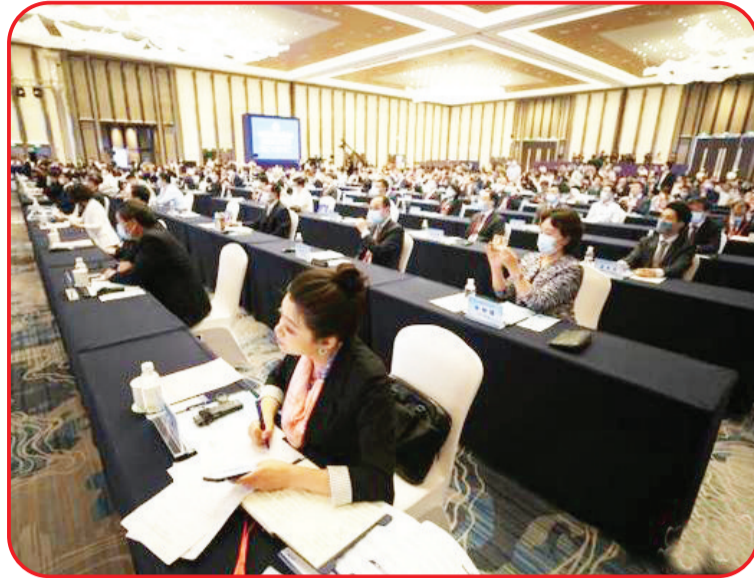
来自全球多个国家和地区以及国际组织的专家学者、业界精英以“线上+线下”的形式汇聚一堂。