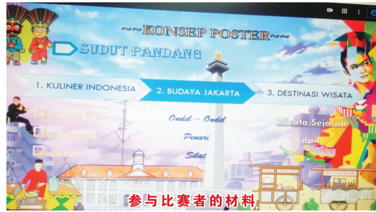
参与比赛者的材料