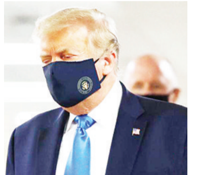
资料图:美国总统特朗普。

综合美媒报道,9月13日,美国总统特朗普在内华达州举行了自6月以来的首场室内竞选集会。但集会期间无视州法规和关于新冠病毒的卫生指导方针,内华达州长指责特朗普采取“鲁莽而自私的行为”,并称这些行为将置生命于危险之中。 据哥伦比亚广播公司报道,在此次集会上,戴口罩的民众相对较少。不过,那些站在特朗普身后的看台上、可能会被摄像机拍到的人,被要求戴上口罩。特朗普在会上表示:“我们不会再次封锁这个国家。封锁将摧毁数百万美国人的生活,他称,美国将很容易击败新冠病毒。” 美国《国会山报》指出,内华达州长希索立克在特朗普上台讲话时,在社交媒体上称,在特朗普举办的集会上,许多与会者似乎没有戴面罩,违反了当地的社交距离规定和白宫建议,总统“似乎忘记了,这个国家仍处于一场全球流行病之中。” 他称:“这(一行),是对每一个遵守指示、做出牺牲、将邻居利益放在自己之上的内华达人的侮辱。这也对我们最近取得的进展,产生直接威胁,可能会使我们倒退。” 报道称,特朗普在集会上还指责希索立克,并对内华达州的民众说:“告诉你们的州长:开放你们的州!” 这是自特朗普在俄克拉荷马州塔尔萨举行室内集会以来,首次举办室内集会。此次集会违反内华达州亨德森市关于禁止举行50人以上室内集会的规定。 此前,亨德森市政府官员指出,“亨德森市已向活动组织者发出了合规信和口头警告,称按计划举行活动,将直接违反州长的新冠紧急指示。(该指示)具体来说,就是禁止50人以上在私人或公共场合集会。” 对此,特朗普竞选团队发言人蒂姆·穆塔回应称:“如果(人们)能与成千上万的人一起在街头抗议、在赌场赌博,或在暴乱中烧毁商店,那么(他们)就可以根据第一修正案,平静地聚集在一起,听美国总统的报告。” 竞选活动官员补充说,将向所有与会者提供口罩,并“鼓励”佩戴。根据该活动组织方,所有与会者都将接受体温检查。