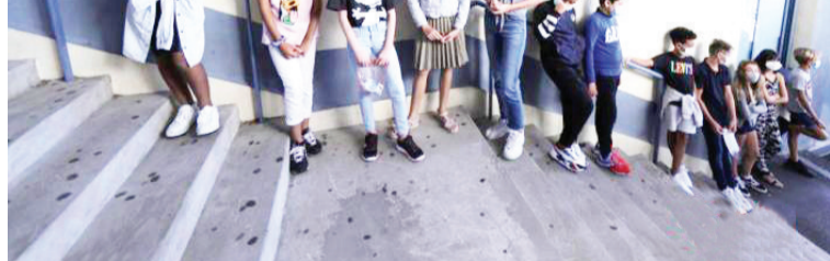
当地时间9月1日,法国尼斯,学生度过暑假后返校上课,老师和学生在室内外均佩戴口罩做好防护措施。

中新网9月14日电 据英国广播公司(BBC)报道,法国最近新冠疫情出现反弹。当地时间12日,法国出现单日确诊新病例突破一万以上的情况,且确诊病例仍呈上涨趋势。与此同时,欧洲其他国家也出现了疫情反弹的迹象。 据报道,在法国,由于感染新冠病毒而住院以及进入重症监护室的病人数量均在增长。 当地时间9月13日,法国一个医生团体在《星期日日报》(Le Journal du Dimanche)上发表专栏文章,督促人们尽量避免私下聚会,防止进一步感染。 自6月份以来,法国新冠感染病例在各个年龄段都有上升,但法国官员说病例增长在年轻人中间尤为严重。 根据9月12日的数据,法国单日新增10561个新冠病例,住院病人接近2500人,比前一日大幅上升。 其中,400多人还需要进入重症监护病房治疗,重症病人同样比前一日增多。另外,还有17人死亡。 报道称,截至目前,法国死于新冠的总人数已经超过3万,新冠死亡人数排在全球第七位。