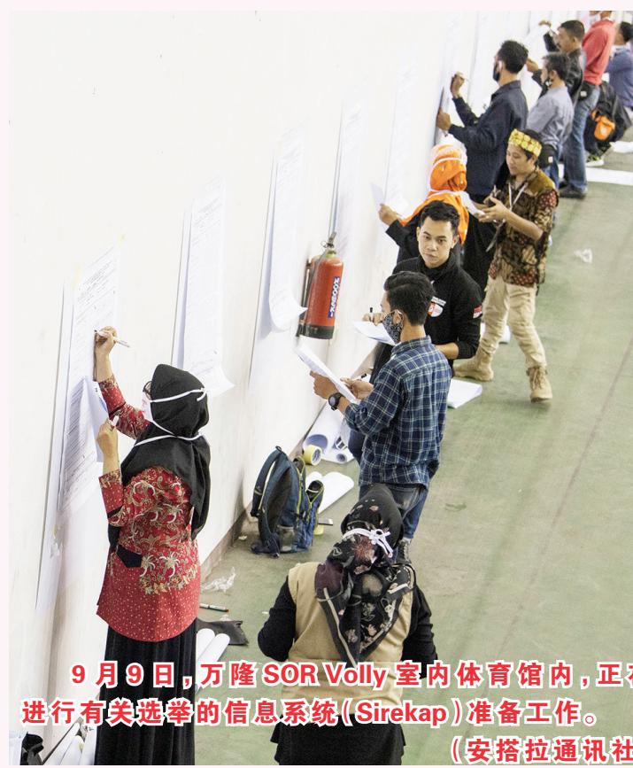
9月9日,万隆SOR Volly室内体育馆内,正在进行有关选举的信息系统(Sirekap)准备工作。