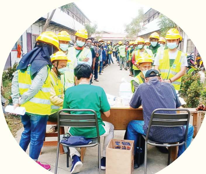
进场印尼籍人员做快速检测

为了做好复工复产首榀箱梁混凝土浇筑质量,工程技术人员对中方管理人员进行了模板混凝土岗培训、钢筋工程岗培训、预应力工程岗培训、安全质量岗培训。从钢筋绑扎、混凝土浇筑、梁体养生全过程培