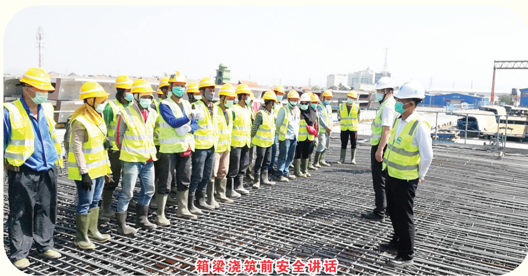
箱梁浇筑前安全讲话

本报万隆讯 9月7日上午,中国中铁印尼雅万高铁4号梁场(中铁四局承建)顺利完成复工以来首榀箱梁浇筑,迎来全面箱梁浇筑施工大干阶段。