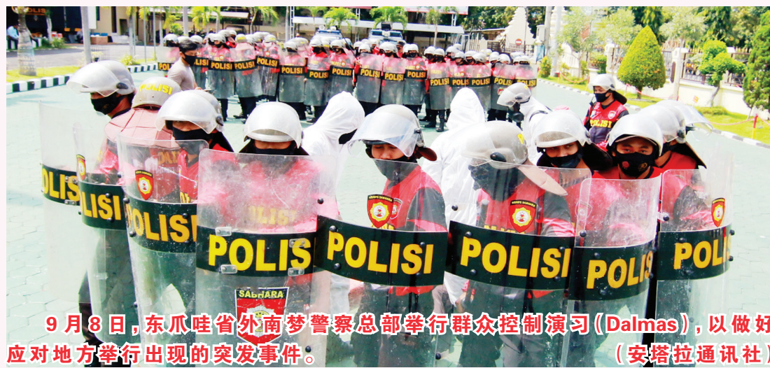
9月8日,东爪哇省外南梦警察总部举行群众控制演习(Dalimas),以做好应对地方举行出现的突发事件。

选举原定投票日期为9月23日。因疫情蔓延,佐科于5月4日签署紧急法令将该项大规模选举活动推延到年底。7月14日,印尼国会通过地方首长选举延期法令正式确定选举投票日为12月9日。