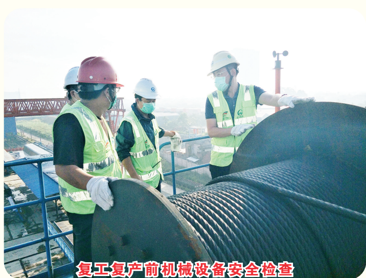
复工复产前机械设备安全检查