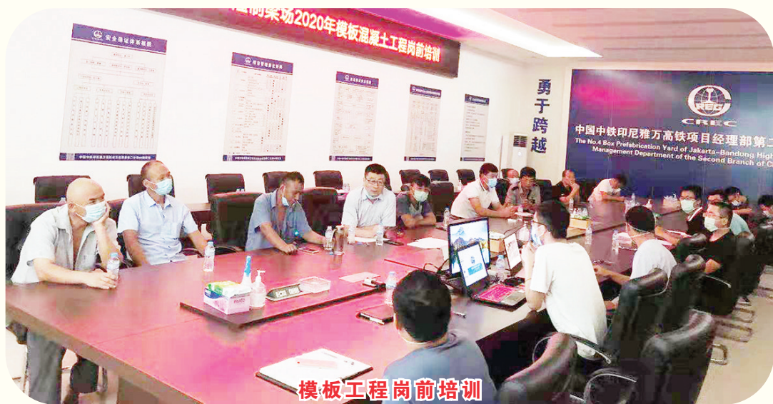
模板工程岗前培训