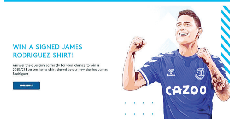
埃弗顿俱乐部网站截图。