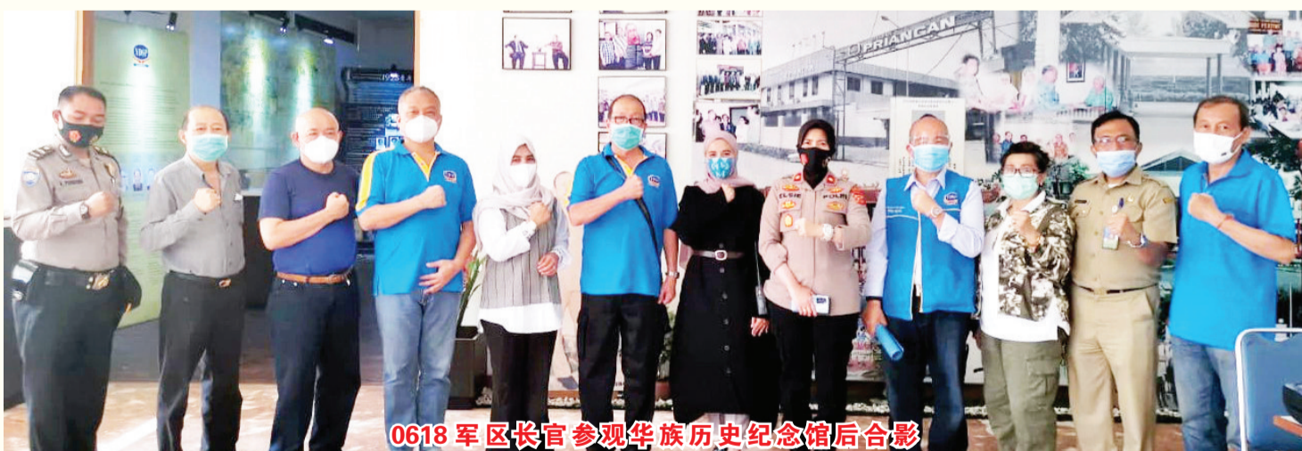
0618军区长官参观华族历史纪念馆后合影