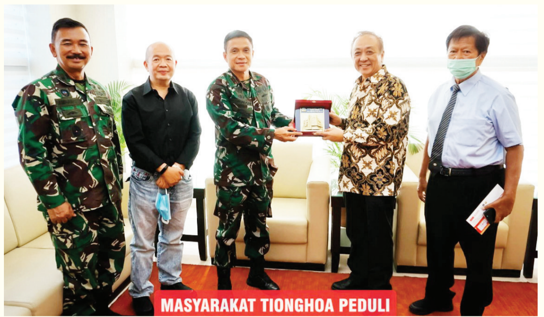
MASYARAKAT TIONGHOA PEDULI