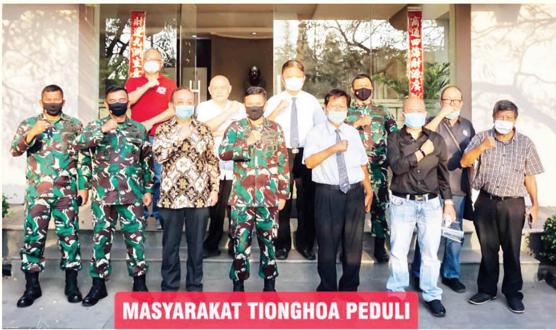
MASYARAKAT TIONGHOA PEDULI