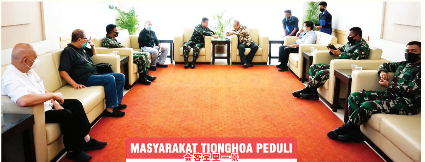
MASYARAKAT TIONGHOA PEDULI 会客室里一景