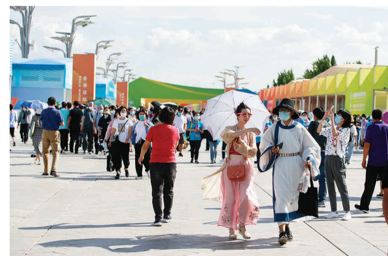
9月8日,北京,2020年中国国际服务贸易交易会室外临时场馆观众云集。

在双方经贸交往不断深化、密切的背景下,服务贸易也有着巨大增长潜力。首先,双方可加强在