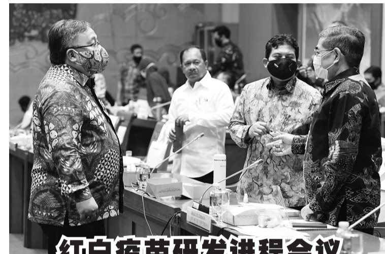
红白疫苗研发进程会议

防洪水库、节制提坝、桁架活动便桥和抗震房屋等。” 他补充说,为减少新日惹国家机场的洪灾风险,公共工程与民居部通过Serayu Opak河流区域的水力资源总署,在Bogowonto河和Serang河两河流域一带建造数座防洪基础设施。